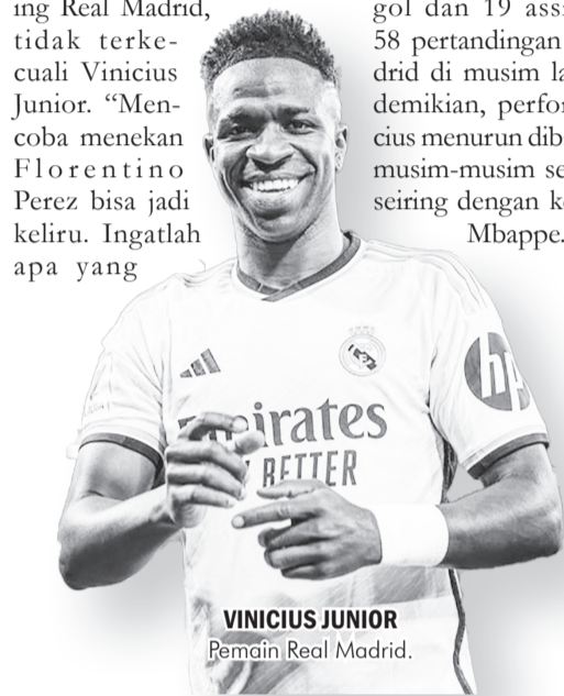
VINICIUS JUNIOR Pemain Real Madrid.

Vinicius mengemas 22 gol dan 19 assist dalam 58 pertandingan Real Madrid di musim lalu. Meski demikian, performa Vinicius menurun dibandingkan musim-musim sebelumnya seiring dengan kedatangan Mbappe. ● vdp