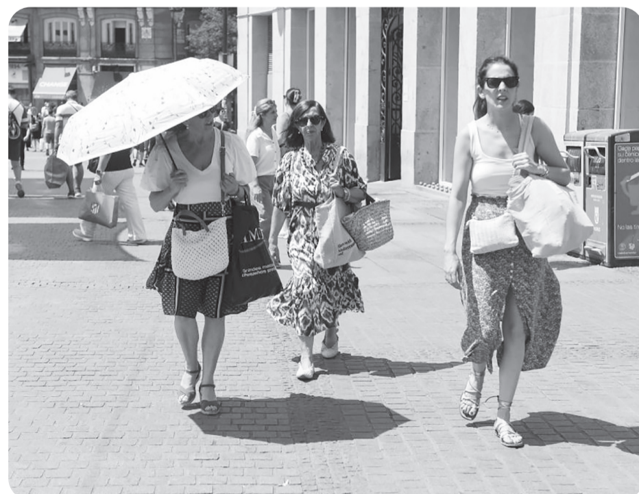
GELOMBANG PANAS LANDA SPANYOL

Rudal jelajah supersonik BrahMos bisa diluncurkan dari kapal selam, kapal perang permukaan, pesawat, atau platform darat. Senjata ini diproduksi oleh usaha patungan Organisasi Penelitian dan Pengembangan Pertahanan (DRDO) India dan NPO Mashinostroyeniya Rusia. ● ans