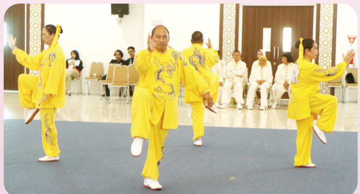
Penampilan Jurus beregu yang dipertandingan dalam ADYTI Fornas VIII.