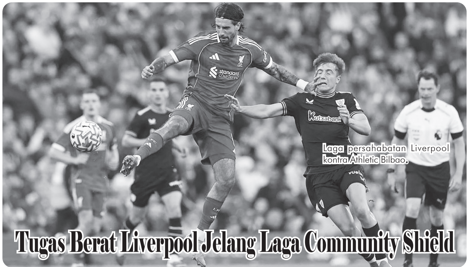
Laga persahabatan Liverpool kontra Athletic Bilbao.