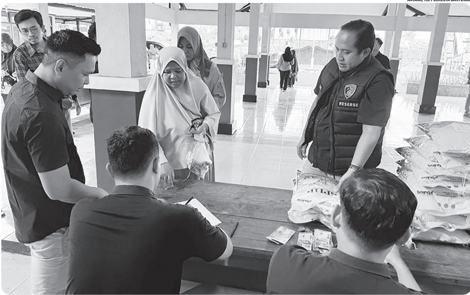
POLRESTA BANYUMAS GELAR GERAKAN PANGAN MURAH

Salah seorang warga membeli beras SPHP dalam kegiatan GPM (Gerakan Pangan Murah) yang digelar Satgas Pangan Polresta Banyumas di Kelurahan Pasir Kidul, Kecamatan Purwokerto Barat, Kabupaten Banyumas, Jawa Tengah, Selasa (5/8/2025). Satgas Pangan Polresta Banyumas bersama Bulog salurkan beras SPHP.