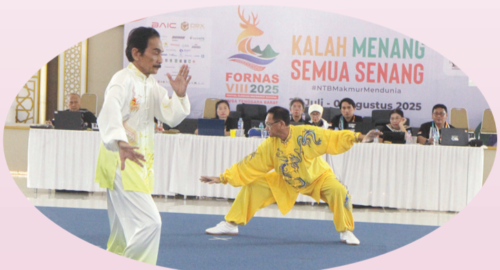
Salah satu jurus yang dipertandingkan dibawakan salah satu peserta.