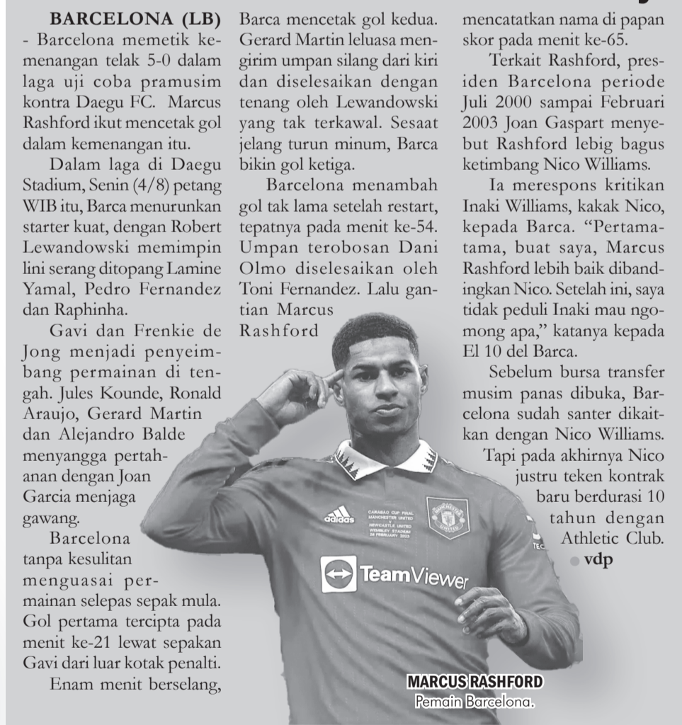
MARCUS RASHFORD Pemain Barcelona.

Idzes saat ini masih mengikuti laga pramusim bersama Venezia. Pelatih Giovanni Stroppa juga masih mengutamakan Idzes di laga-laga pramusim. ● vdp