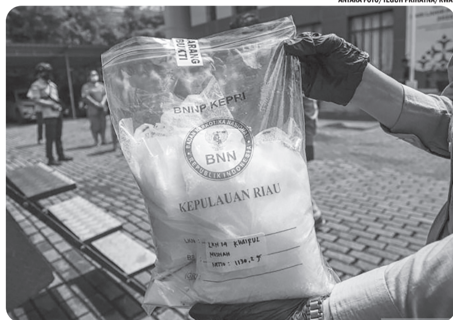
BNN KEPRI MUSNAHKAN BARANG BUKTI NARKOTIKA