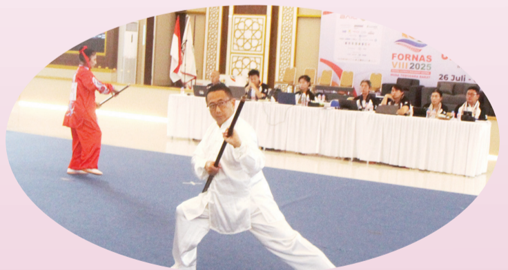
Peserta membawakan jurus dengan tongkat yang dipertandingkan.