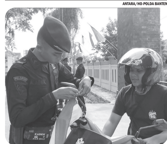
GERAKAN MERAH PUTIH DI BANTEN