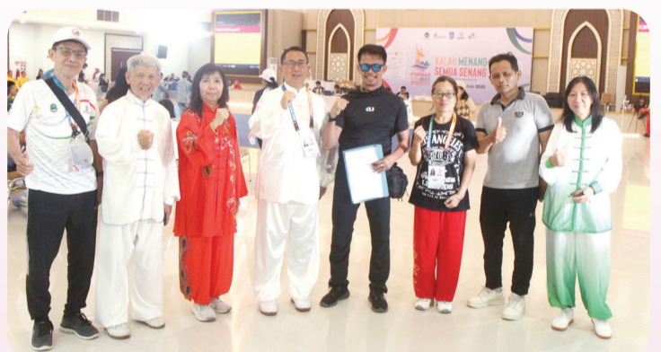
Perwakilan Korni Jawa Barat berfoto bersama Ketua dan pengurus ADYTI Prov Jawa Barat.