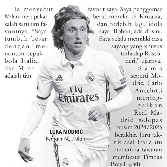
LUKA MODRIC Pemain AC Milan.

Sama seperti Modric, Carlo Ancelotti meninggalkan Real Madrid selepas musim 2024/2025 berakhir. Juru taktik asal Italia itu menerima tawaran membesut Timnas Brasil. ● vit