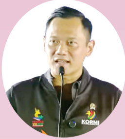
Menko Agus Harimurti Yudhoyono