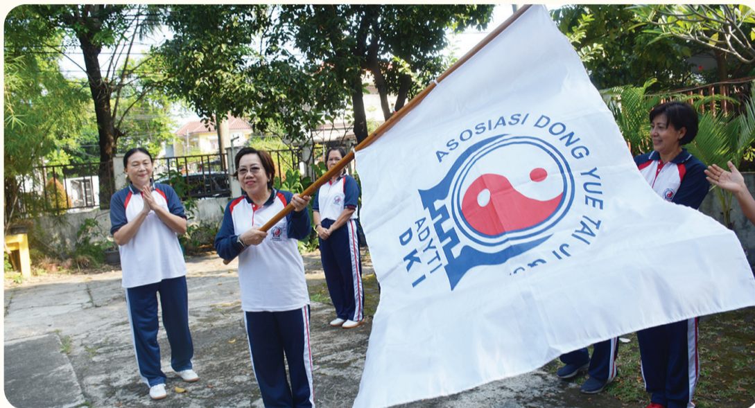
Prosesi penyerahan pataka.