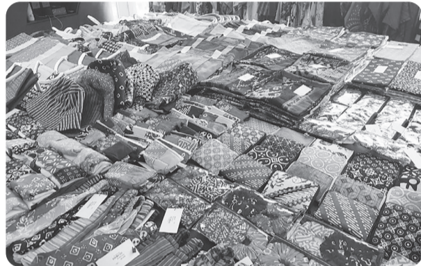
SELENDANG MAYANG DAYA FEST 2025

Produk kerajinan tangan UMKM binaan SMBC Indonesia yang dipamerkan di Selendang Mayang Daya Fest 2025 di Jakarta, Rabu (27/8/2025). SMBC Daya Fest 2025 buka peluang pasar UMKM dengan pembinaan.