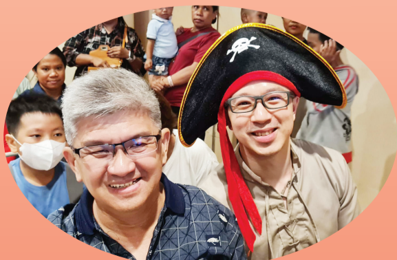
Orang tua murid antusias menghadiri acara.