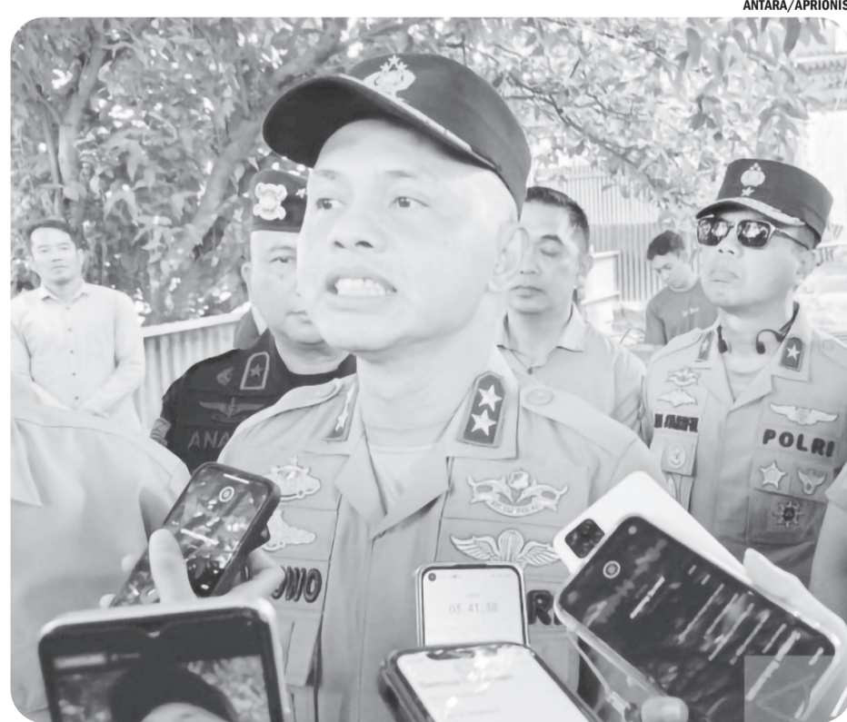
POLDA BABEL KERAHKAN 2.889 PERSONEL AMANKAN PILKADA ULANG

"(Korban) masih sekolah. Kami juga mendingar ada beberapa alumni yang diduga mengalami hal serupa. Silakan segera melapor, bisa langsung ke Polres, KPAD, maupun Dinas DP3A," ujarnya. • osm