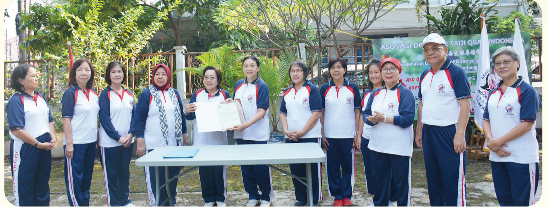
Prosesi pelantikan dan penyerahan surat keputusan.

JAKARTA (LB) — Dewan Pengurus Sasana ADYTI Damai Kosambi Baru masa bakti 2025 – 2027 telah resmi dilantik. Prosesi pelantikan dilangsungkan pada Selasa (26/8/2025) pagi di Lapangan Olahraga, Jl. Mahoni Hijau V, Perumahan Kosambi Baru, Cengkareng, Jakarta Barat.