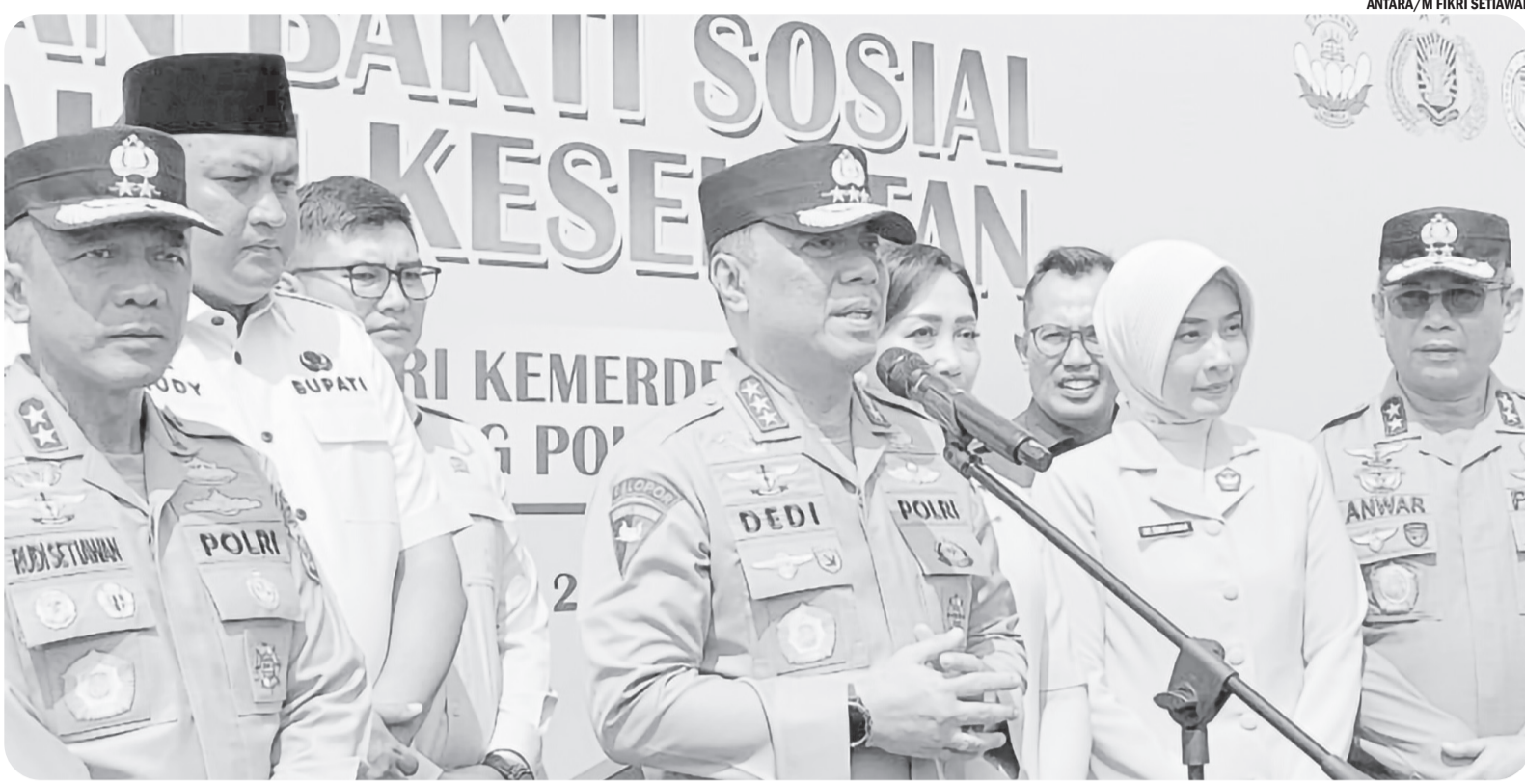
POLRI BAKSOS DAN BAKKES DI GUNUNG SINDUR

Wakapolri (Wakil Kepala Kepolisian Negara Republik Indonesia) Komjen Dedi Prasetyo memimpin baksos (bakti sosial) dan bakkes (bakti kesehatan) di Desa Cibinong, Gunung Sindur, Kabupaten Bogor, Jawa Barat, Rabu (27/8/2025). Wakapolri menyatakan Polisi hadir di tengah masyarakat lewat Baksos dan Bakkes.