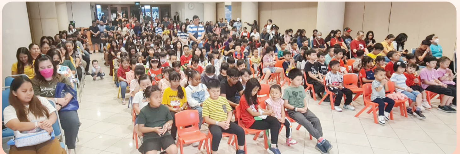
Anak-anak hadir dengan tertib dan gembira.

Karena itu, setiap anak Sekolah Minggu yang hadir wajib didampingi orang tua mereka. Namun, bagi anak-anak yang orang tua-