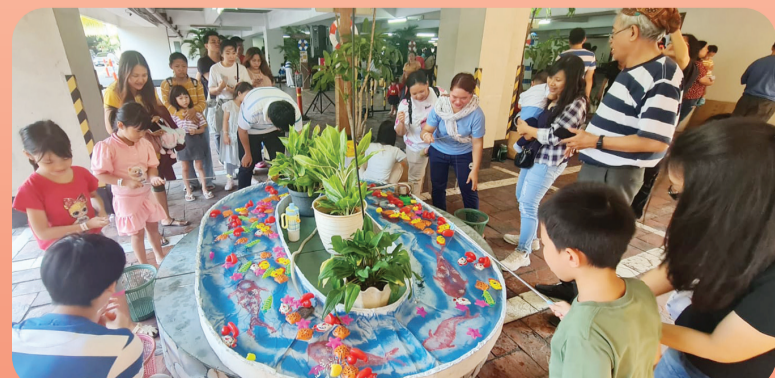
Anak-anak memancing ikan.