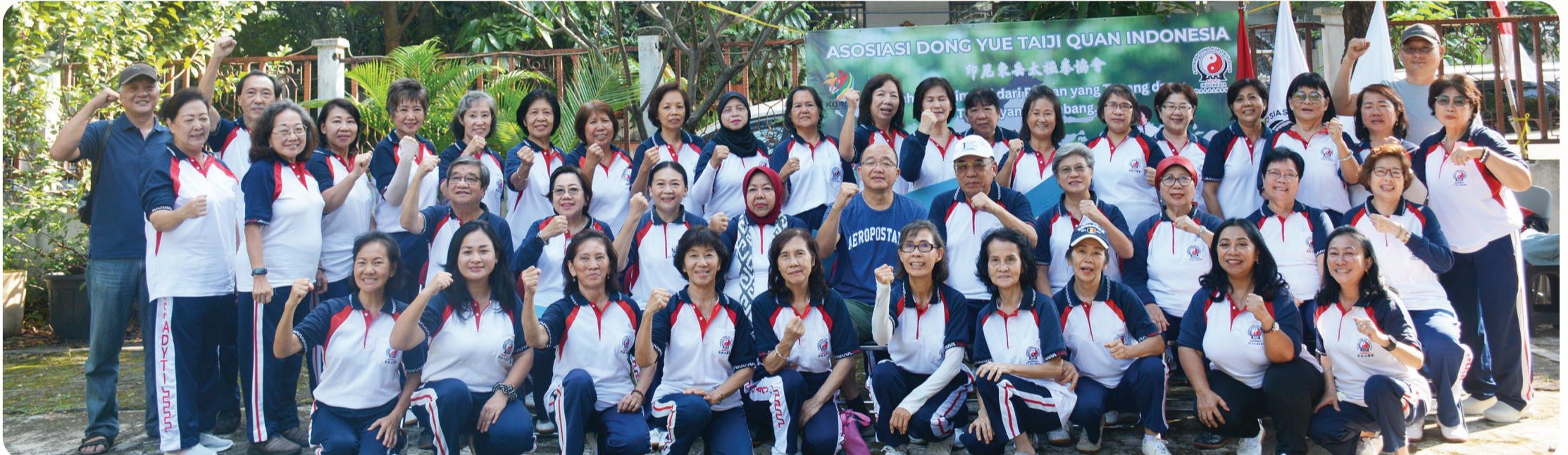
Segenap hadirin berfoto bersama.