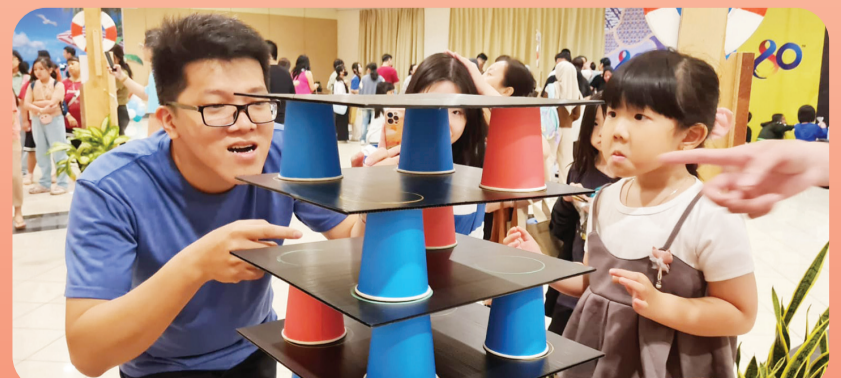
Anak-anak sedang berusaha mendapatkan hadiah.