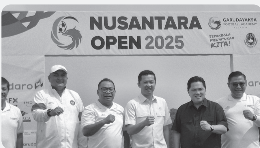
Bupati Bogor bersama Ketua PSSI, Erick Thohir dan Bupati Bekasi menghadiri event sepak bola nusantara 2025, di Bekasi, Senin (25/8).