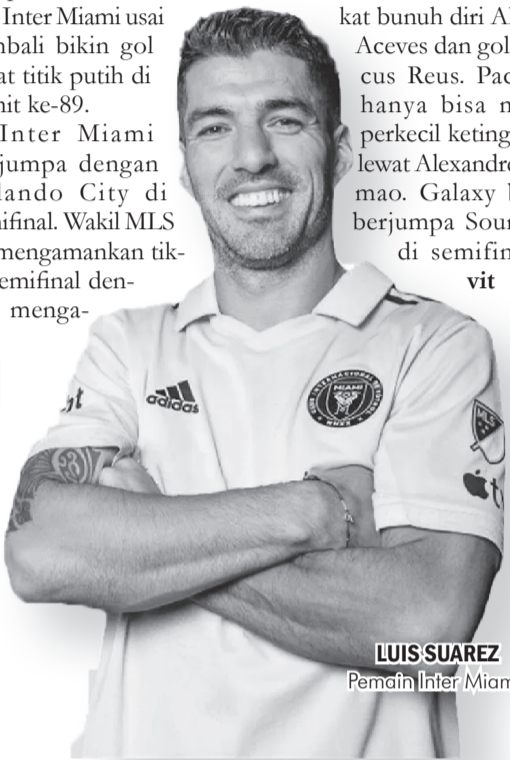
LUIS SUAREZ Pemain Inter Miami.