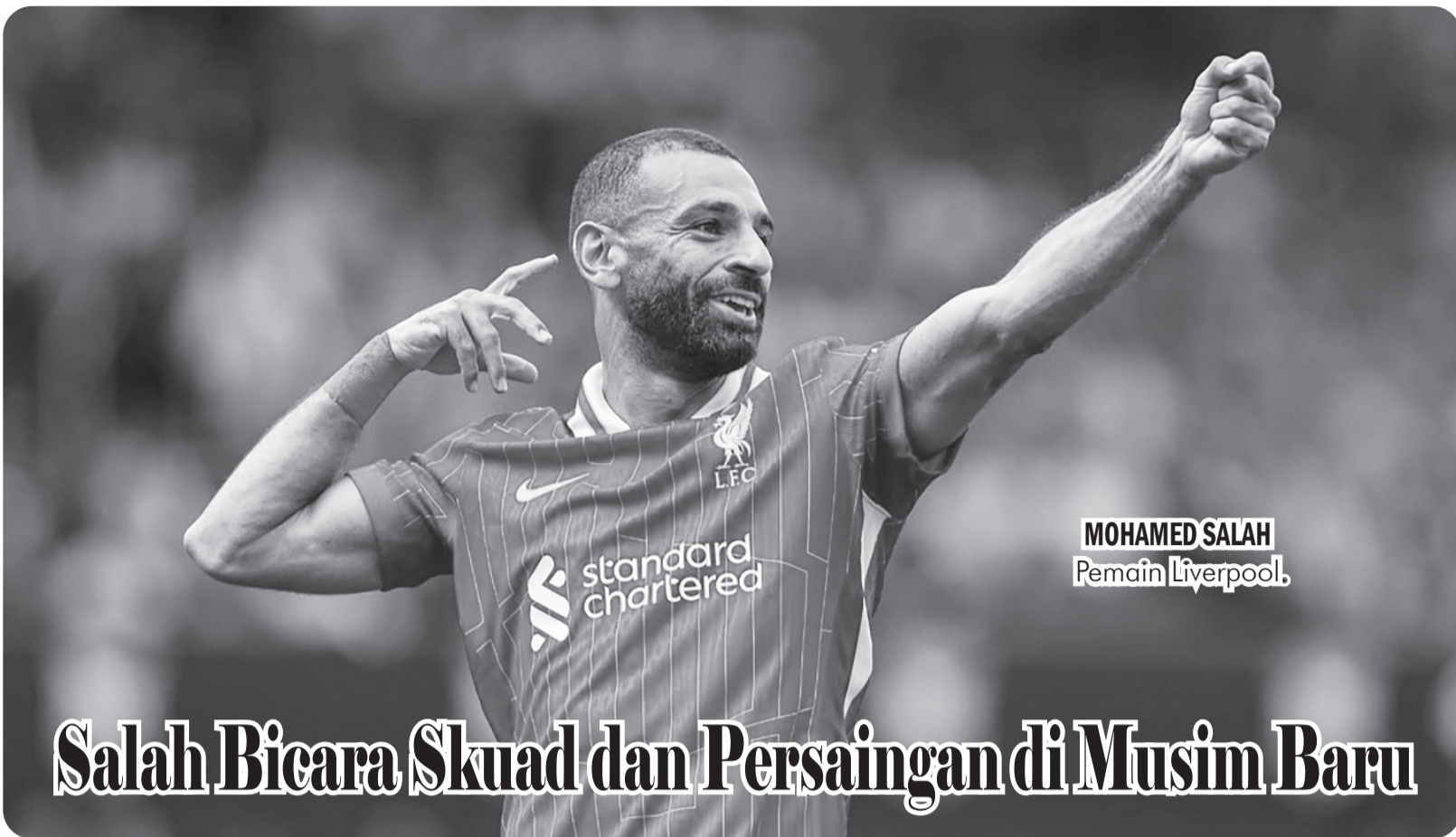
MOHAMED SALAH Pemain Liverpool.