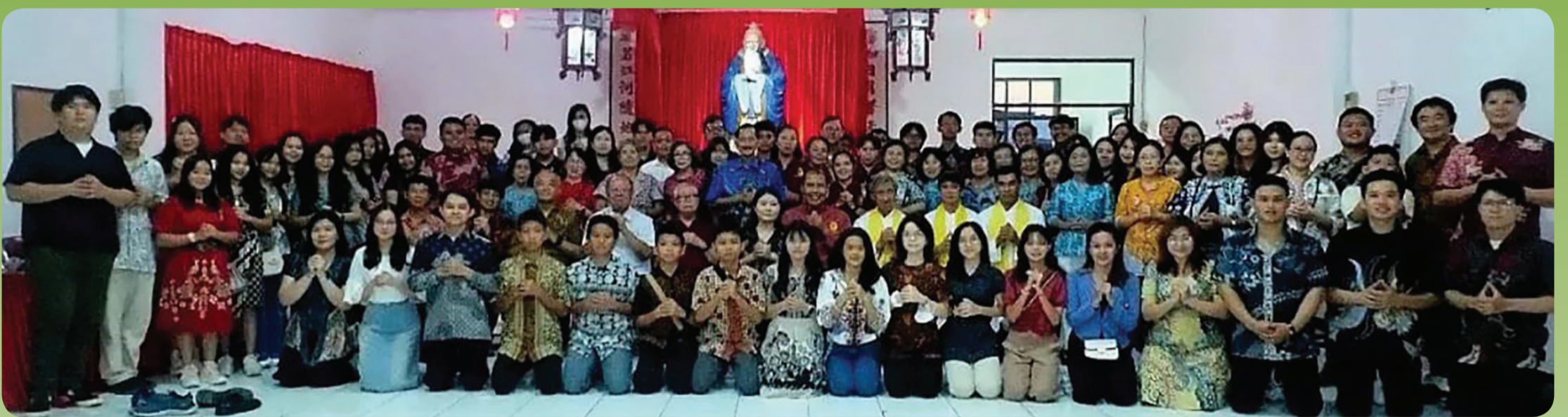
Seluruh peserta ibadah bersama umat Khonghucu berfoto bersama.

JAKARTA (LB) - Peringatan HUT (Hari Ulang Tahun) ke-80 Kemerdekaan RI pada tahun 2025 menjadi momentum bersejarah bagi seluruh rakyat Indonesia.