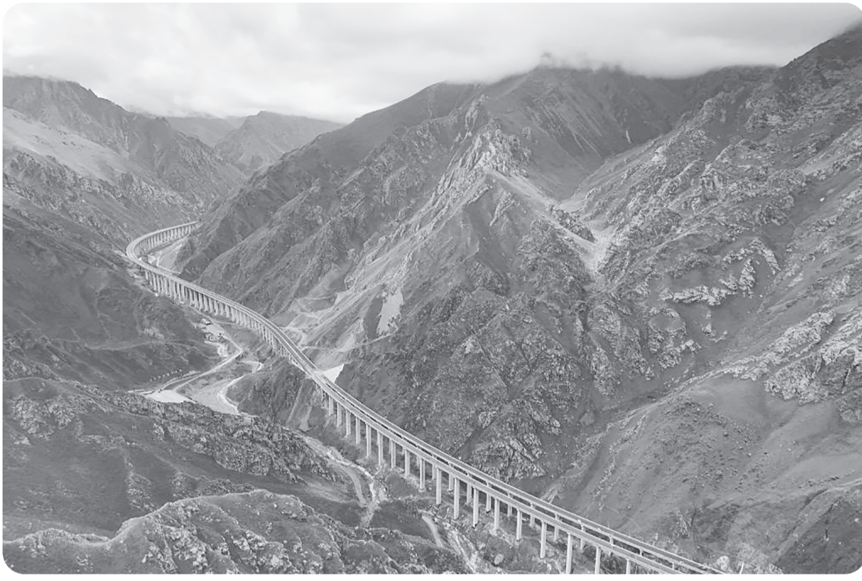
Foto udara yang diambil dari drone pada Rabu (19/8/2025) menunjukkan Jalan Tol Urumqi-Yuli yang sedang dibangun, melintasi Pegunungan Tianshan di Daerah Otonomi Uighur Xinjiang, Tiongkok. Jalan Tol Urumqi-Yuli sepanjang 319,7 km, yang membentang dari ibu kota Urumqi di Xinjiang utara hingga Kabupaten Yuli di Xinjiang selatan, diperkirakan akan siap untuk lalu lintas pada akhir tahun ini.