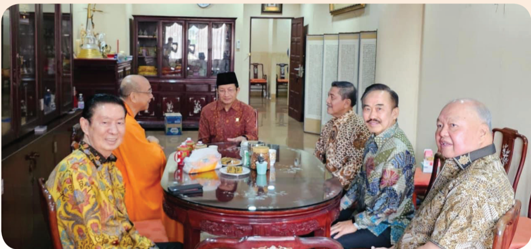
Menag Nasaruddin Umar bersama Bhiksu Prajnavira Mahasthavira, Didi Dawis, Laksamana (purn) Marsetio, Halim Mina dan Mujianto.

Hadir dalam kegiatan ini Forkopimda Sumut, Bupati Deli Serdang, OPD Sumut, tokoh agama serta umat Buddha lainnya. ● vit