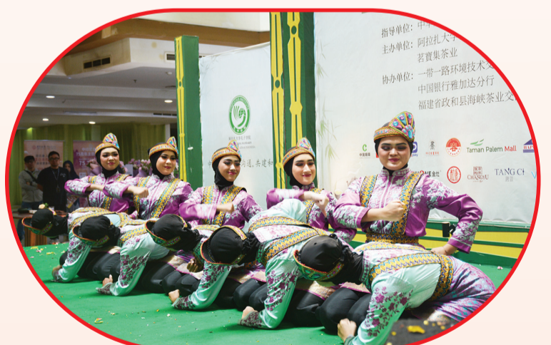
Pertunjukan tari tradisional Saman dari Aceh.