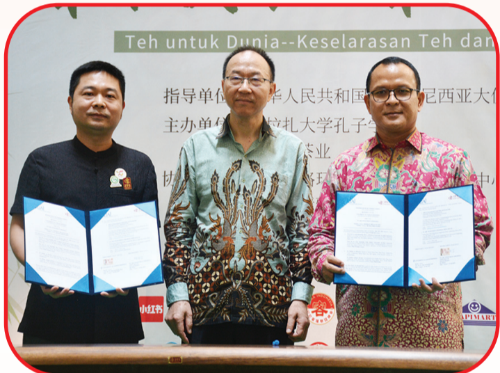
Penandatanganan Nota Kesepahaman (MoA) antara PBM UAI dan Ming Bao Ji.

Selain itu diadakan juga penandatanganan Nota Kesepahaman (MoA) antara PBM UAI dan Perusahaan Teh Ming Bao Ji. • kris