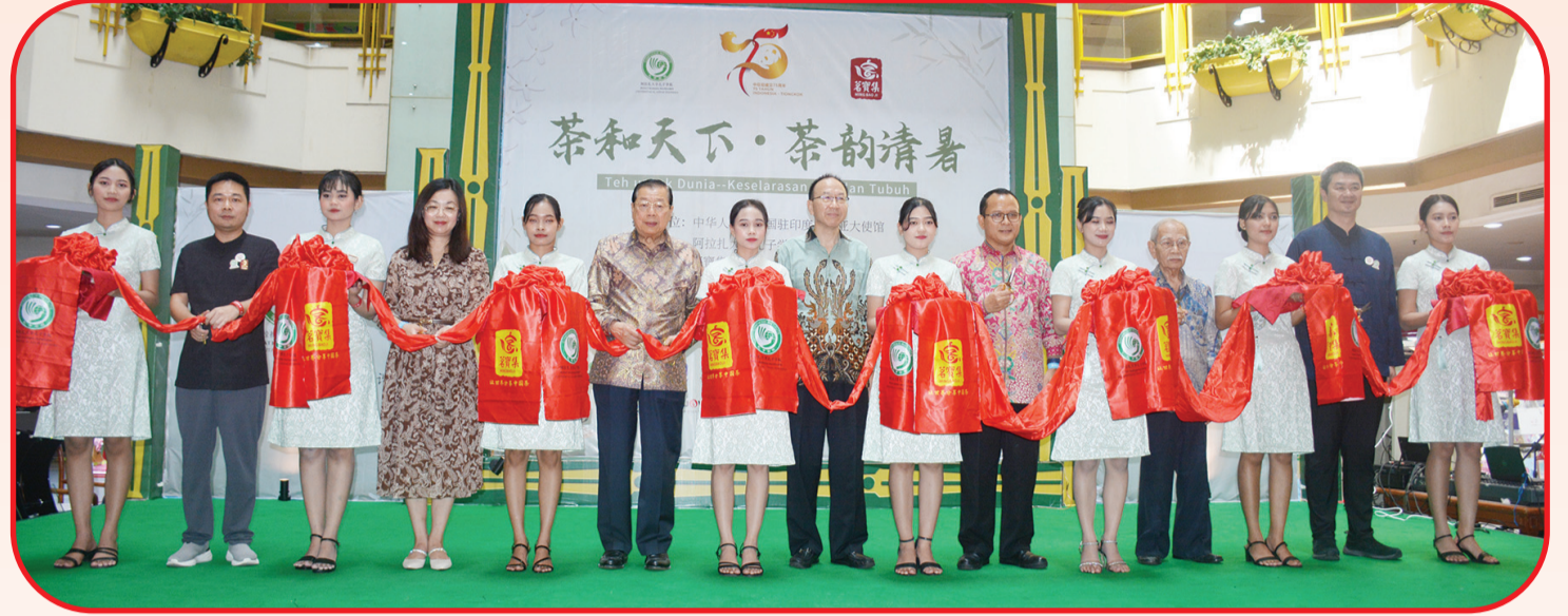
Prosesi pengguntingan pita.