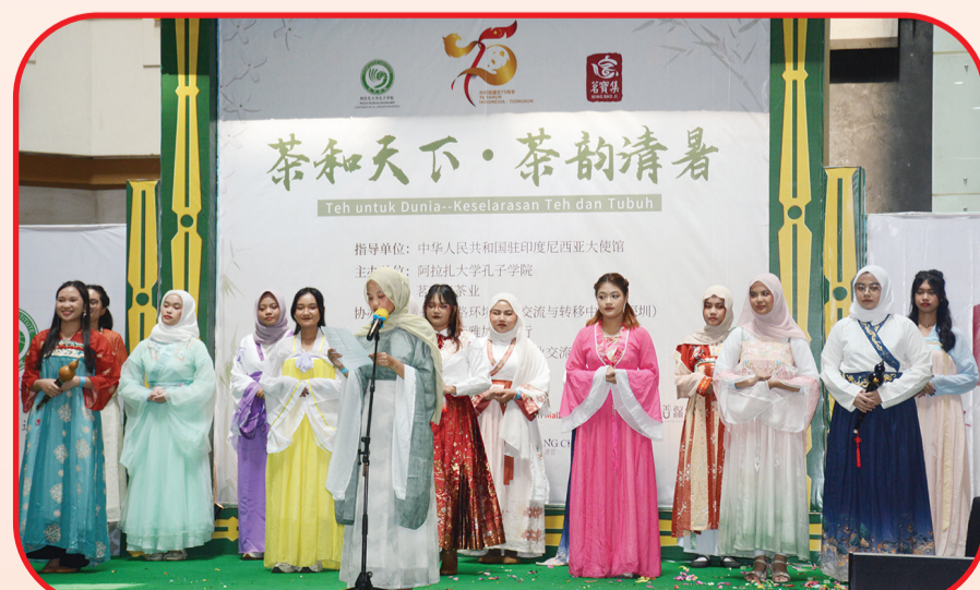
Peragaan busana Hanfu dari mahasiswi Institut Konfusius UAI.