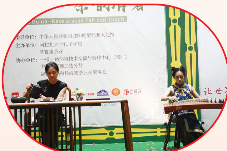
Pertunjukan seni minum teh dan alat musik Guzheng.