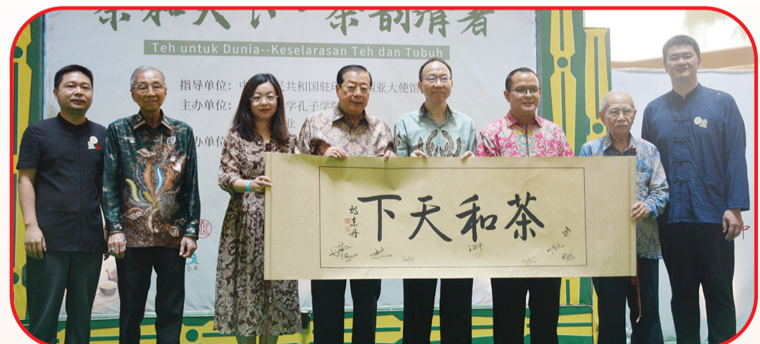
Para tamu kehormatan berfoto bersama usai membubuhkan tanda tangan di atas lukisan.