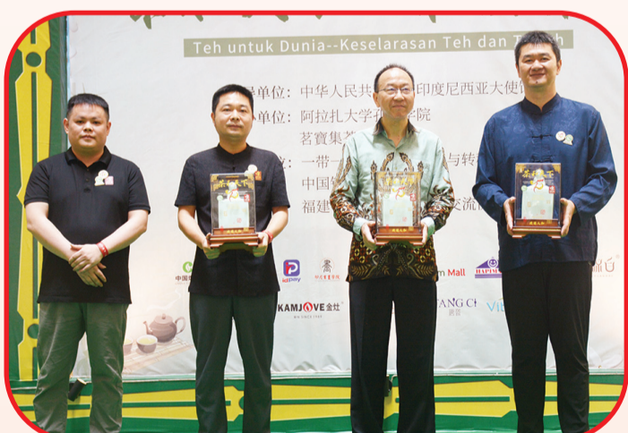
Pemberian cenderamata berupa teh.