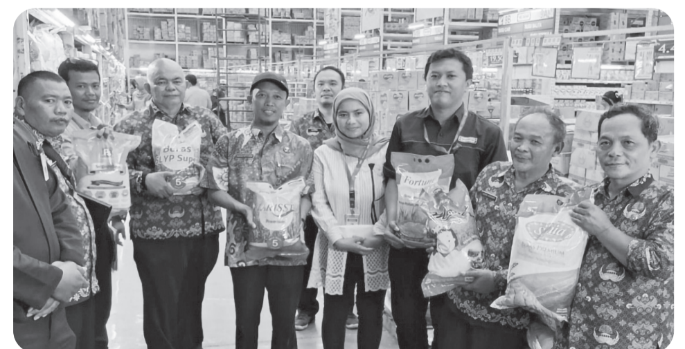
Beras oplosan marak di sejumlah toko modern, Disdagin Kabupaten Bogor sidak Supermarket dan sejumlah toko.

"Ini menjadi jaminan atas keamanan serta kualitas bagi