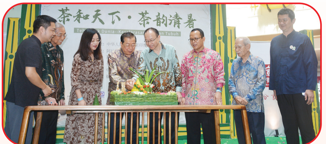
Prosesi potong nasi tumpeng.