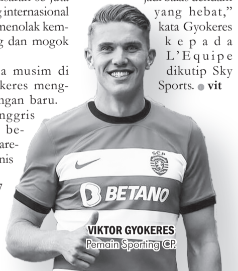
VIKTOR GYOKERES Pemain Sporting CP.

Pemain 27 tahun itu merupakan mantan pemain Brighton & Hove Albion, tapi