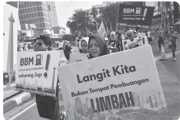
AKSI ALIANSI UDARA BERSIH

Sejumlah warga yang tergabung dari Aliansi Udara Bersih melakukan aksi berjalan kaki pada Hari Bebas Kendaraan Bermotor di kawasan Bundaran HI, Jakarta Pusat, Minggu (13/7/2025). Pada aksinya mereka mengajak masyarakat untuk mengurangi polusi udara dan emisi karbon dengan menggunakan transportasi umum.