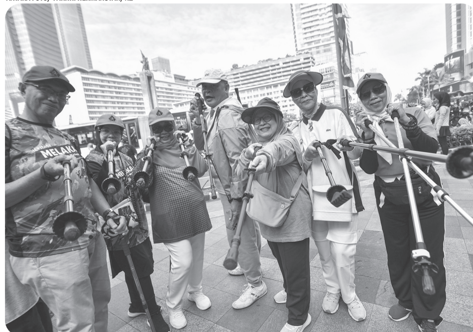
KJNI BERJALAN KAKI DI HBKB

Warga lanjut usia (lansia) yang tergabung dalam Komunitas Jalan Nordic Indonesia (KJNI) berfoto bersama dengan menunjukkan tongkat hiking atau trekking pole pada Hari Bebas Kendaraan Bermotor (HBKB) di kawasan Bundaran HI, Jakarta Pusat, Minggu (13/7/2025). Pada kegiatan tersebut KJNI berjalan sejauh 5 km untuk mensosialisasikan gaya hidup sehat kepada masyarakat.