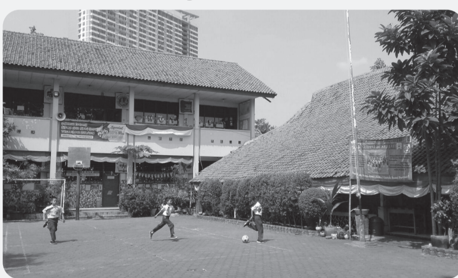
SDN 15 Tangerang.

"Padahal orangtua saya udah bayar lunas seragam itu semuanya, kok dibilangnya belum lunas. Udah gitu kepala sekolah pula yang negur saya melalui pesan WhatsApp ibu saya. Enggak pantas tindakan salah di sekolah negur kaya gitu, " tandasnya dengan nada kesal, Jum'at (11/7) kemarin