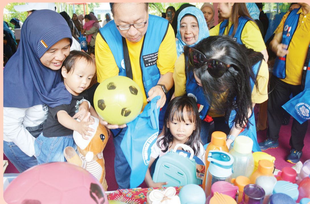
Anak-anak saat memilih hadiah yang disediakan oleh panitia.

“Saya berharap anak-anak dapat mengingat apa yang mereka terima di kegiatan ini, dan itu bisa memotivasi mereka untuk berusaha menjadi pribadi yang baik. Semoga kenangan ini mem-