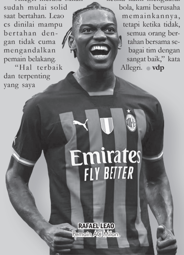
RAFAEL LEAO Pemain AC Milan.

senangi adalah tim menunjukkan sikap positif dalam 20 hari pertama kerja. Mereka benar-benar meningkatkan level kemampuan untuk bertahan, dan ini berarti ketika kami menguasai bola, kami berusaha memainkannya, tetapi ketika tidak, semua orang bertahan bersama sebagai tim dengan sangat baik," kata Allegri. ● vdp