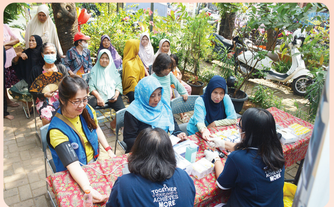
Layanan pemeriksaan kesehatan gratis.