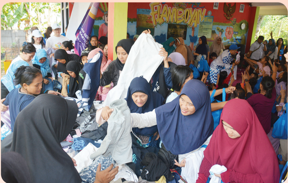
Para orang tua memilih pakaian layak pakai yang disediakan panitia.