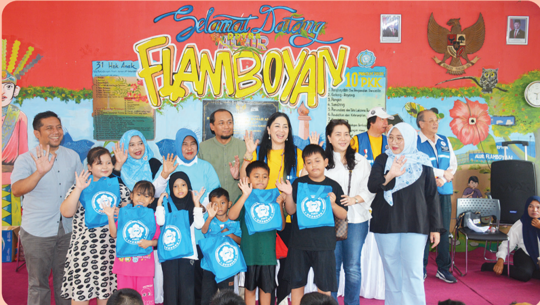
Penyerahan bantuan untuk anak-anak.