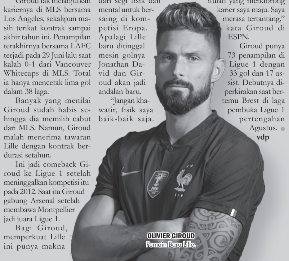
OLIVIER GIROUD Pemain Baru Lille.

Giroud punya 73 penampilan di Ligue 1 dengan 33 gol dan 17 assist. Debutnya diperkirakan saat bertemu Brest di laga pembuka Ligue 1 pertengahan Agustus. ● vdp