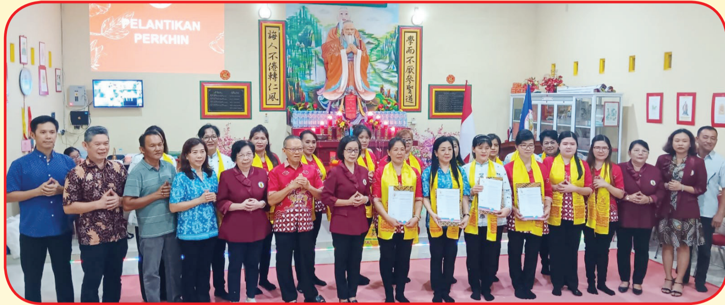
Pelantikan PERKHIN Provinsi Kep. Babel, Kota Pangkal Pinang, Kabupaten Bangka dan Merawang periode 2025-2027.