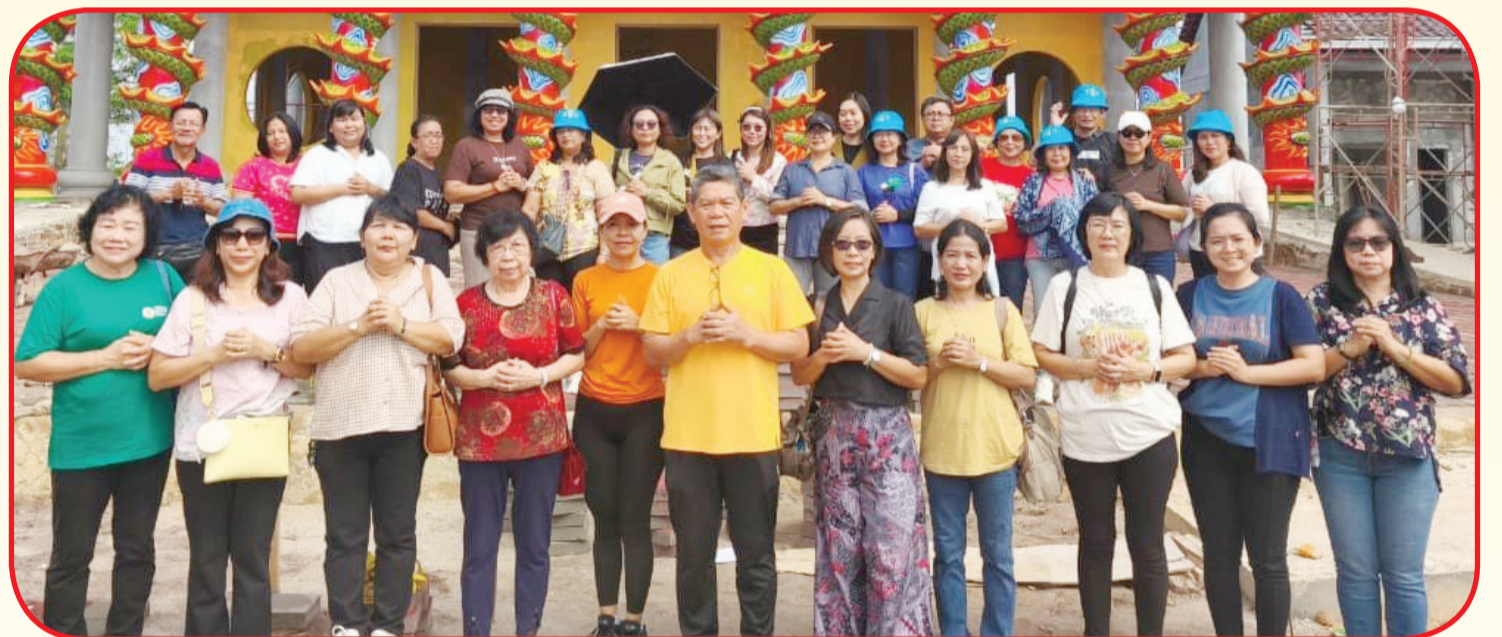
Foto bersama rombongan usai meninjau proyek pembangunan SeTiAKIN.