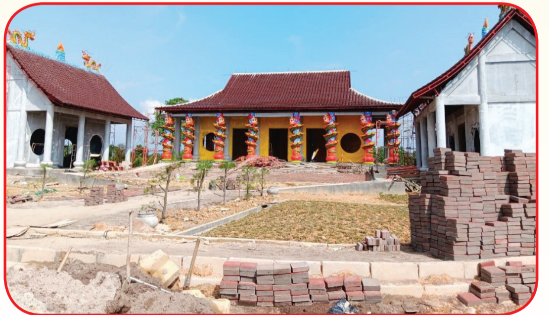
Progres Pembangunan Kong Miao didalam kompleks SeTiAKIN.