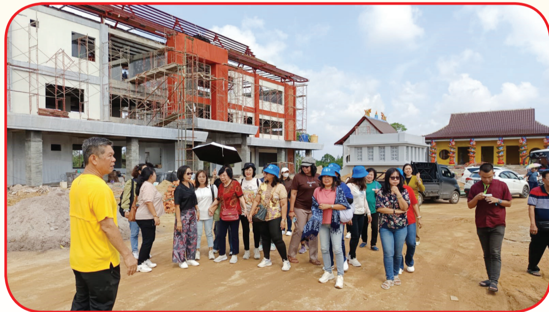
Rombongan PERKHIN meninjau proyek pembangunan SeTiAKIN di Tanjung Bunga, Pangkalpinang, Kep. Babel.