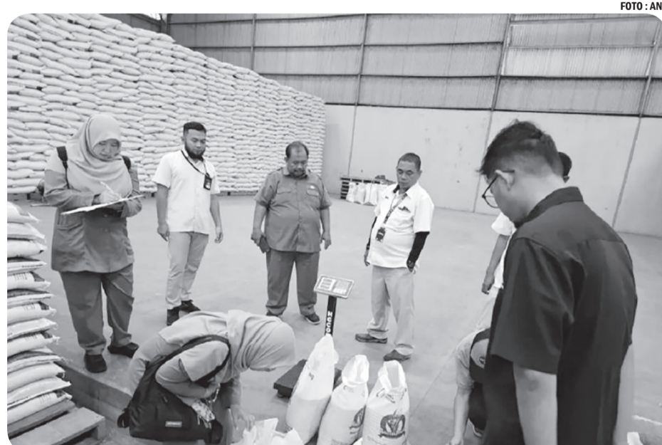
UJI SAMPEL BERAS UNTUK CEGAH ADANYA OPLOSAN Pemeriksaan beras di gudang Bulog Tangerang oleh tim DKP Kota Tangerang. DKP Tangerang siapkan uji sampel beras di pasar cegah adanya oplosan.

Pengembangan MRT Lebak Bulus-Serpong merupakan bagian dari visi besar pemerintah dalam menyediakan transportasi publik yang terintegrasi, aman, dan berkelanjutan, sekaligus mendukung pertumbuhan ekonomi kawasan Jabodetabek. ● pra