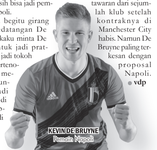
KEVIN DE BRUYNE Pemain Napoli

De Bruyne sebelumnya mengaku sempat mendapat tawaran dari sejumlah klub setelah kontraknya di Manchester City habis. Namun De Bruyne paling terkesan dengan proposal Napoli. ● vdp