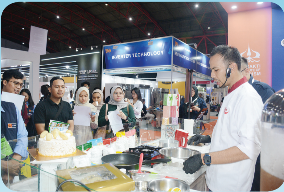
Chef Remy saat melakukan demo membuat Gemblong Cake.

Hal yang menarik dalam perhelatan ini adalah keikutsertaan Institut Pariwisata Trisakti (IP Trisakti), menjadi satu-satunya perguruan tinggi yang turut meramaikan perhelatan Food and Hospitality Indonesia 2025, di Jakarta International Expo (JIExpo) Kemayoran, pada 22-25 Juli 2025.