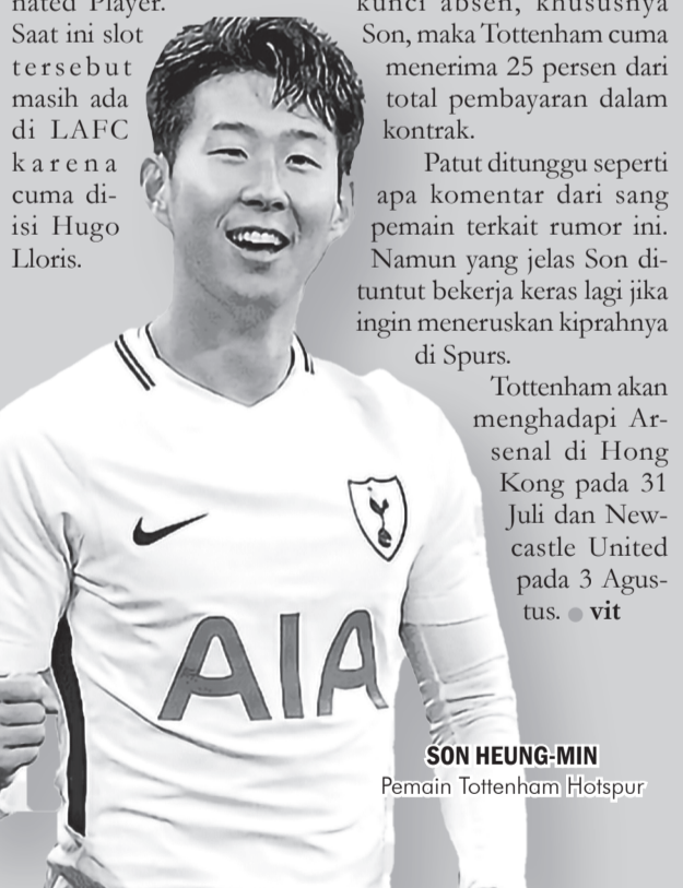
SON HEUNG-MIN Pemain Tottenham Hotspur

LAFC ingin memberikan kontrak besar untuk Son yang tergolong Designated Player. Saat ini slot tersebut masih ada di LAFC karena cuma diisi Hugo Lloris.