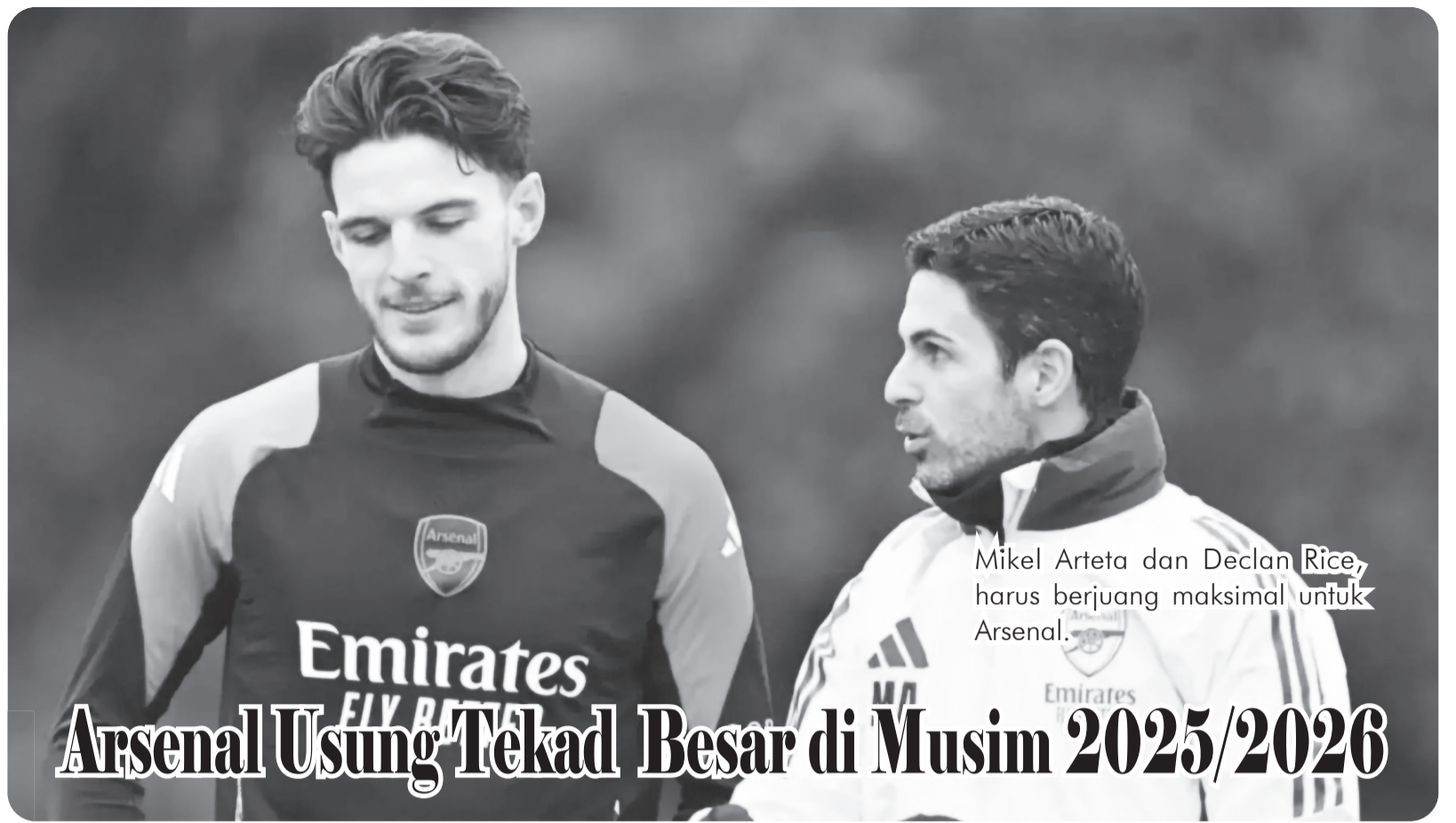
Mikel Arteta dan Declan Rice, harus berjuang maksimal untuk Arsenal.