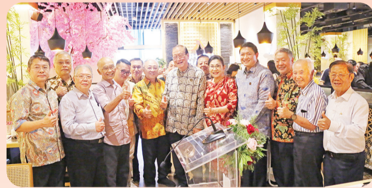
Foto bersama komunitas.

BANDUNG (LB) - PT Summarecon Agung Tbk (Summarecon) meresmikan pembangunan gedung sekolah tahap pertama dari Sekolah Terpadu Sedaya Bintang pada Sabtu (19/7/2025), yang secara resmi akan mulai beroperasi untuk tahun ajaran 2025/2026.