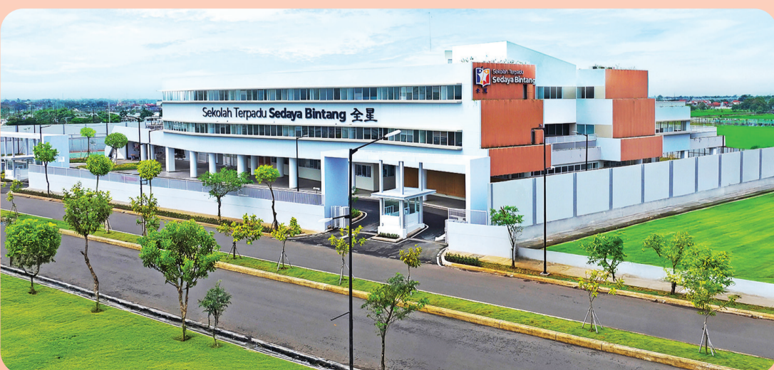
Sekolah Terpadu Sedaya Bintang.