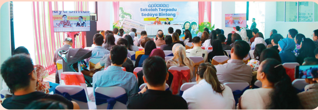
Pertemuan dengan orang tua calon siswa.