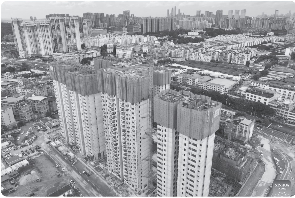
Foto udara yang diambil dari drone pada Senin (21/7/2025) menunjukkan proyek renovasi permukiman perkotaan di Kota Nanning, Daerah Otonomi Guangxi Zhuang, Tiongkok. Sejak tahun ini, Dinas Keuangan Provinsi Guangxi telah mengumpulkan total subsidi keuangan sekitar 3,4 miliar yuan (sekitar 473,9 juta dolar AS) untuk mendukung pembangunan proyek perumahan terjangkau di wilayah perkotaan, yang telah meningkatkan permintaan masyarakat akan perumahan berkualitas tinggi.