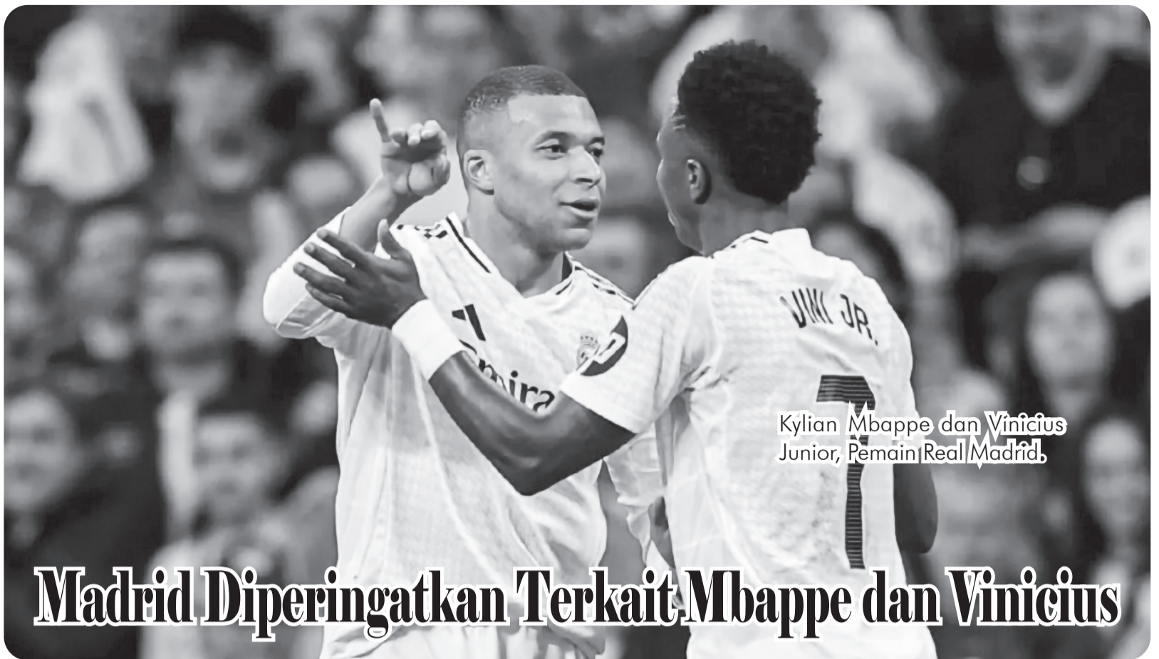
Kylian Mbappe dan Vinicius Junior, Pemain Real Madrid