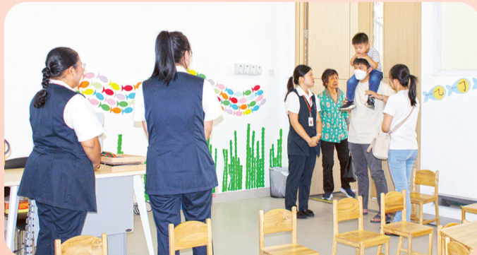
Tour ruangan sekolah.