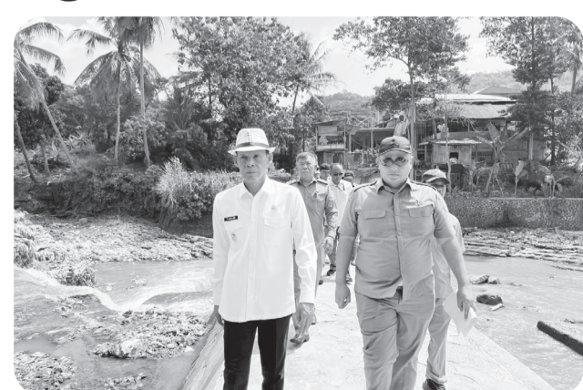
Wakil Bupati Bogor saat sidak ke Desa Kalong Liud Kecamatan Nanggung, Kabupaten Bogor.

Ia menambahkan, ini penting untuk mendukung sektor pertanian warga dan mendukung Asta Cita Presiden Prabowo dalam mewujudkan ketahanan pangan. Pemerintah Kabupaten Bogor berkomitmen menyelesaikan persoalan infrastruktur dasar, termasuk irigasi pertanian, sebagai bagian dari upaya memperkuat ketahanan pangan daerah dan nasional.