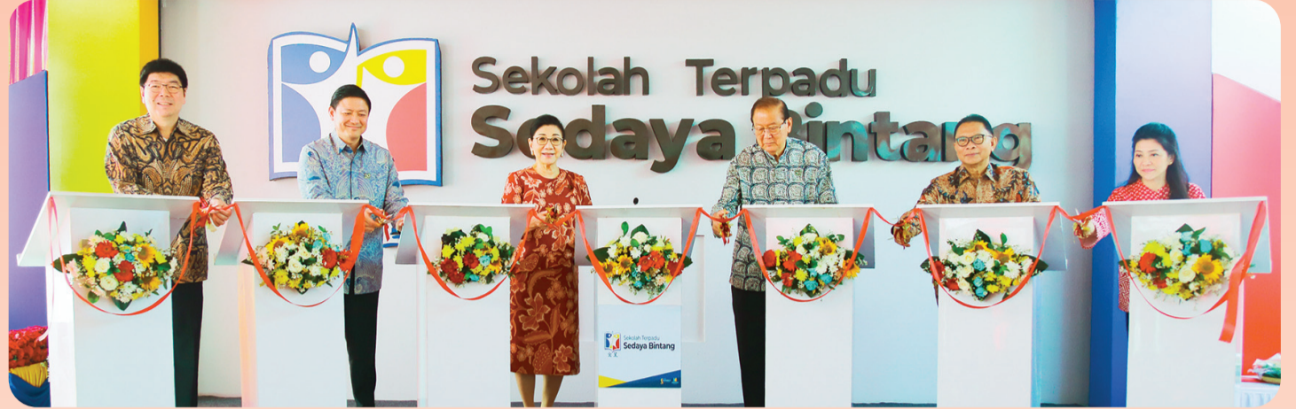
Prosesi gunting pita peresmian.