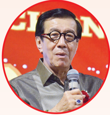
Ketua Dewan Penasehat Yasonna Laoly