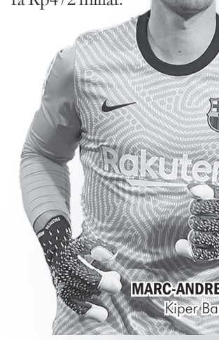
MARC-ANDRE TER STEGEN Kiper Barcelona.

penjaga gawang 24 tahun itu dari Espanyol seharga 25 juta Euro atau setara Rp472 miliar.