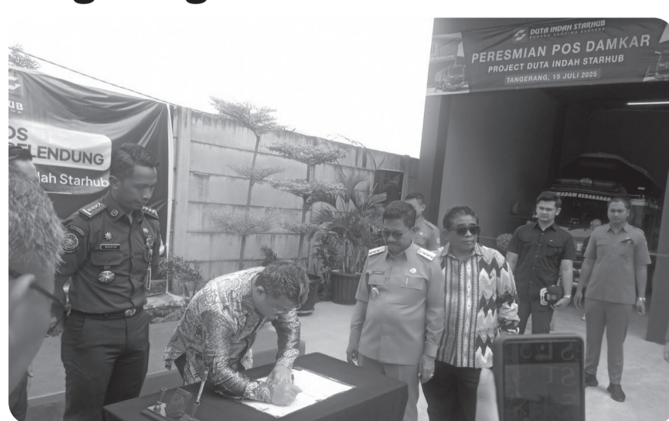
Prosesi peresmian Pos Damkar Belendung, Kota Tangerang.

Ia menambahkan, momen ini sekaligus menjadi titik penting untuk mem-