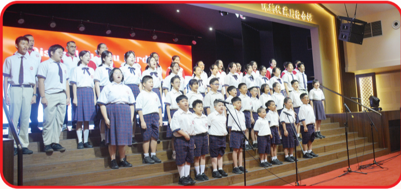
Sejumlah murid dan guru menyanyikan lagu Kebangsaan Indonesia Raya.