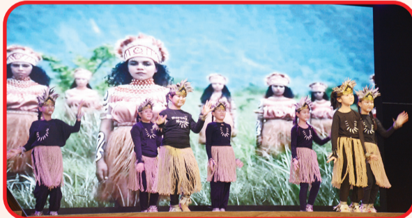
Sejumlah murid membawakan tarian tradisional Indonesia.