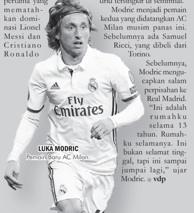
LUKA MODRIC Pemain Baru AC Milan.

Capaiannya itu kian lengkap dengan keberhasilan Modric memenangkan Ballon d'Or 2018. Ia menjadi pemain pertama yang mematahkan dominasi Lionel Messi dan Cristiano Ronaldo