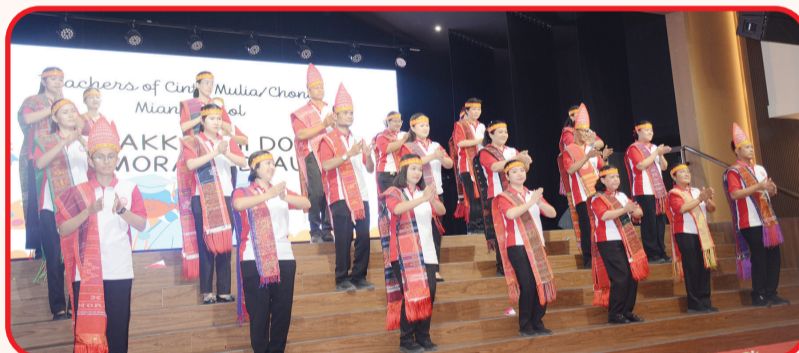
Para guru tampil dengan busana tradisional Indonesia.