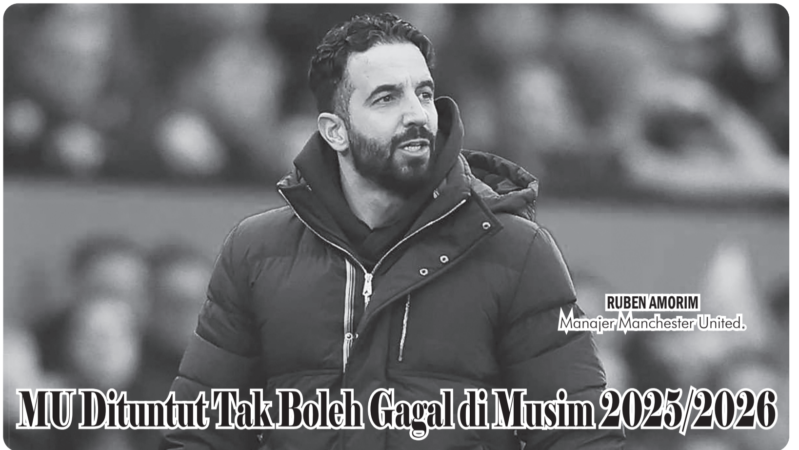
RUBEN AMORIM Manajer Manchester United.