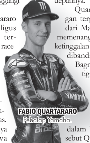
FABIO QUARTARARO Rebalap Yamaha.

"Kami lambat dan kami harus bisa memahami kenapa bisa kesulitan seperti itu dalam balapan-balapan," sebut Quartararo. ● vdp