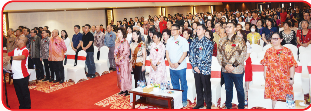
Para hadirin menyanyikan lagu Kebangsaan Indonesia Raya.