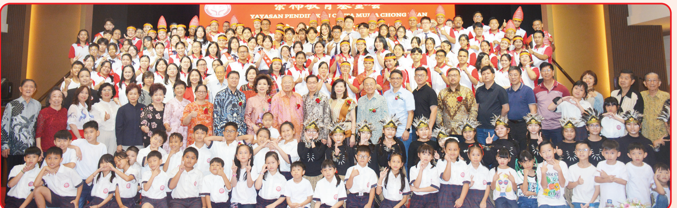
Pimpinan yayasan, kepala sekolah, guru, dan murid berfoto bersama.