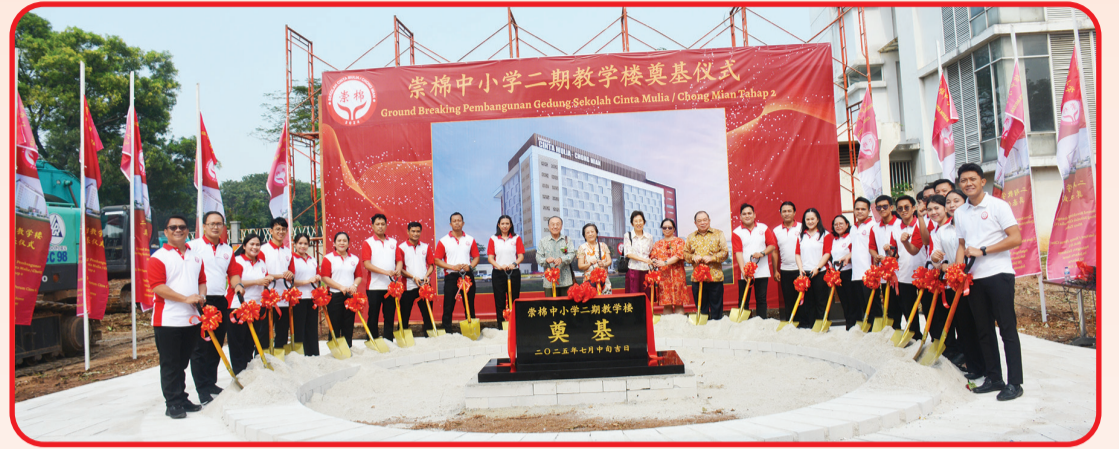
Kepala Sekolah dan guru berfoto bersama saat groundbreaking pembangunan Gedung Sekolah Cinta Mulia/Chong Mian.

JAKARTA (LB) - Sekolah Cinta Mulia-Chong Mian yang berada di Jalan Satu Maret/Komp. Perum Citra 5, Blok H/1, Pegadungan Kalideres, Jakarta Barat, pada Minggu (13/7/2025) menyelenggarakan tiga kegiatan sekaligus.