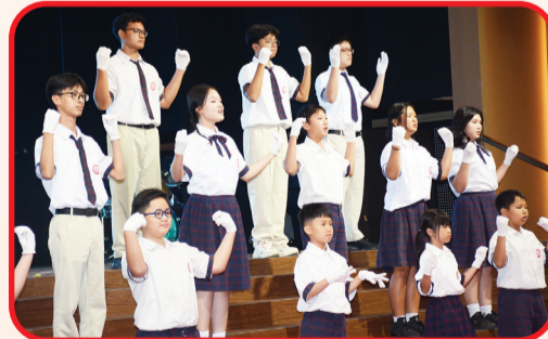
Sejumlah murid tampil membawakan bahasa isyarat tangan.