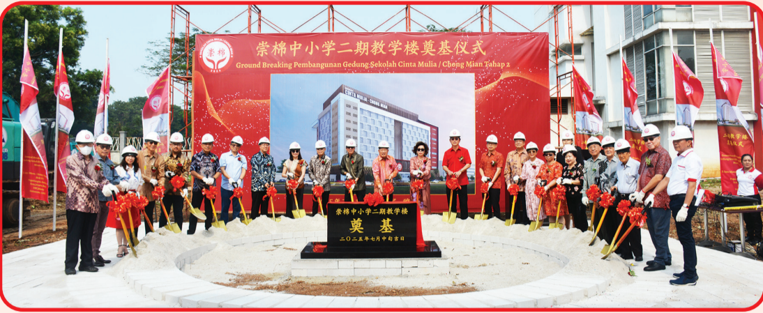
Para tokoh dan pimpinan Yayasan Pendidikan Cinta Mulia berfoto bersama saat groundbreaking pembangunan Gedung Sekolah Cinta Mulia/Chong Mian.