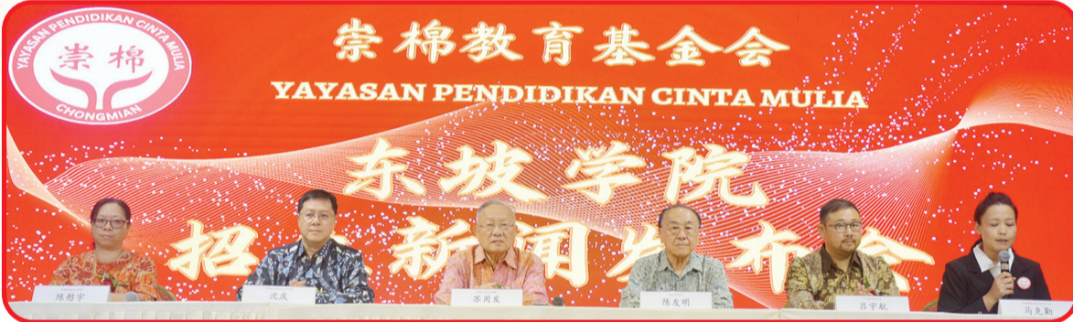
Konferensi pers beroperasinya Akademi Bahasa Asing Sutopo.

Menurutnya Indonesia merupakan satu-satunya yang memenangkan dan mendorong Pendidikan tiga bahasa.