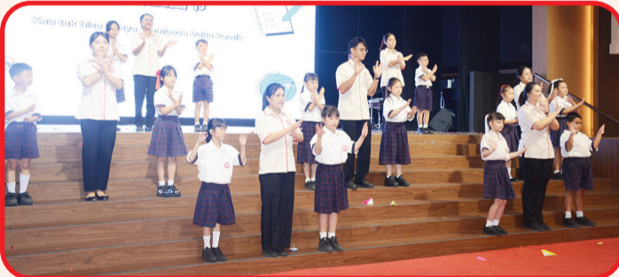
Guru dan murid tampil bersama.