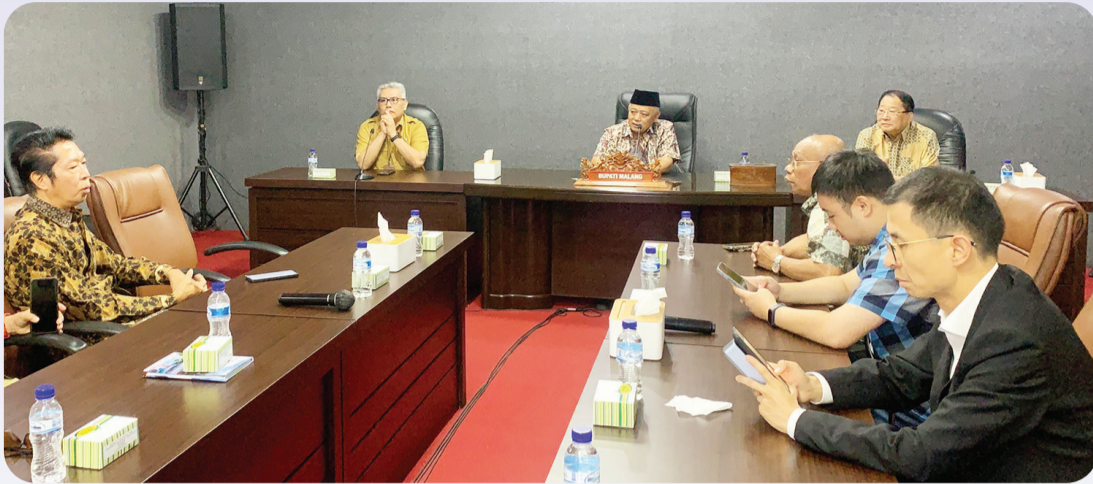
Audiensi Perhimpunan INTI dengan Bupati Malang.