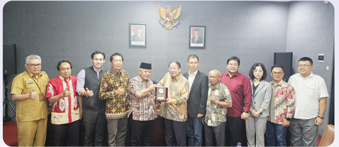
Penyerahan plakat INTI kepada Bupati Malang.