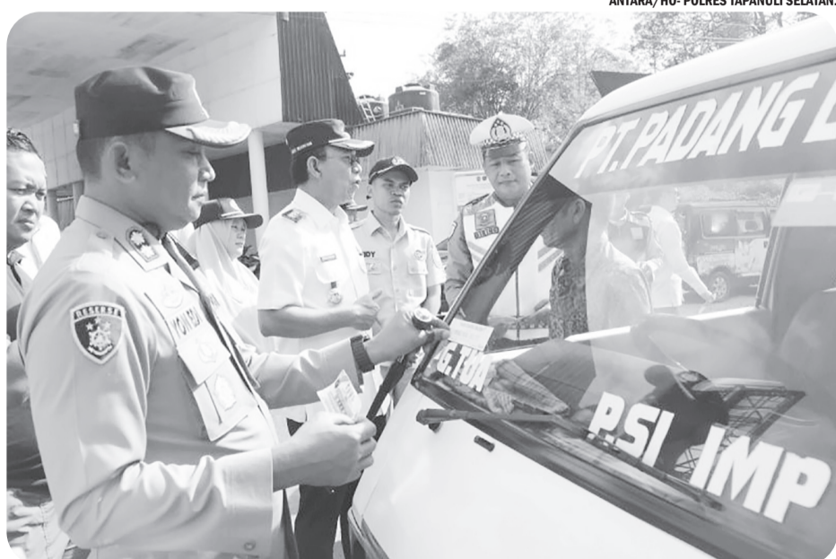
POLRES TAPSEL SOSIALISASI PAJAK Kepolisian Resor Tapanuli Selatan melaksanakan kegiatan sosialisasi pajak di Kota Sipirok, Kabupaten Tapanuli Selatan, Sumatera Utara, Rabu. (30/7/2025). Polres Tapsel: Sosialisasi pajak kendaraan tingkatkan kepatuhan.

transparansi Polri sekaligus meningkatkan kepercayaan publik. Dia menyebut bahwa setiap anggota Polri didorong untuk berperan aktif menyampaikan informasi positif, bukan hanya di dunia nyata, tetapi juga di ruang digital. Dengan adanya Policetube, Polri optimis dapat mendekatkan diri kepada masyarakat, menyebarkan informasi yang akurat, sekaligus membuktikan bahwa kerja-kerja kepolisian hadir nyata untuk melindungi, mengayomi, dan melayani masyarakat. Adapun Divisi Humas Polri pada Rabu ini menyelenggarakan dan menggelar pelatihan penggunaan platform Policetube serta Humas Pintar Presisi. Kegiatan yang dibuka langsung oleh Kadiv Humas Polri Irjen Pol. Sandi Nugroho itu diikuti oleh 288 peserta secara tatap muka dan 2.080 peserta melalui daring. Dia mengatakan bahwa sosialisasi dan pelatihan ini penting agar jajaran Polri siap memanfaatkan Policetube sebagai media publikasi modern berbasis video. "Semoga dengan adanya sosialisasi dan pelatihan ini, jajaran Polri semakin siap menghadapi tantangan ke depan, sekaligus memperkuat profesionalisme dan kehumasan yang modern, transparan, dan dipercaya masyarakat," katanya. ● osm