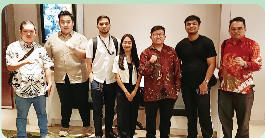
Panitia GEMA INTI Nobar Film Believe.

JAKARTA (LB) - GEMA INTI (Generasi Muda Indonesia DKI Jakarta) mengadakan nonton bareng film Believe pada Minggu (27/7) sore di bioskop XXI Mall Ciputra Jakarta.