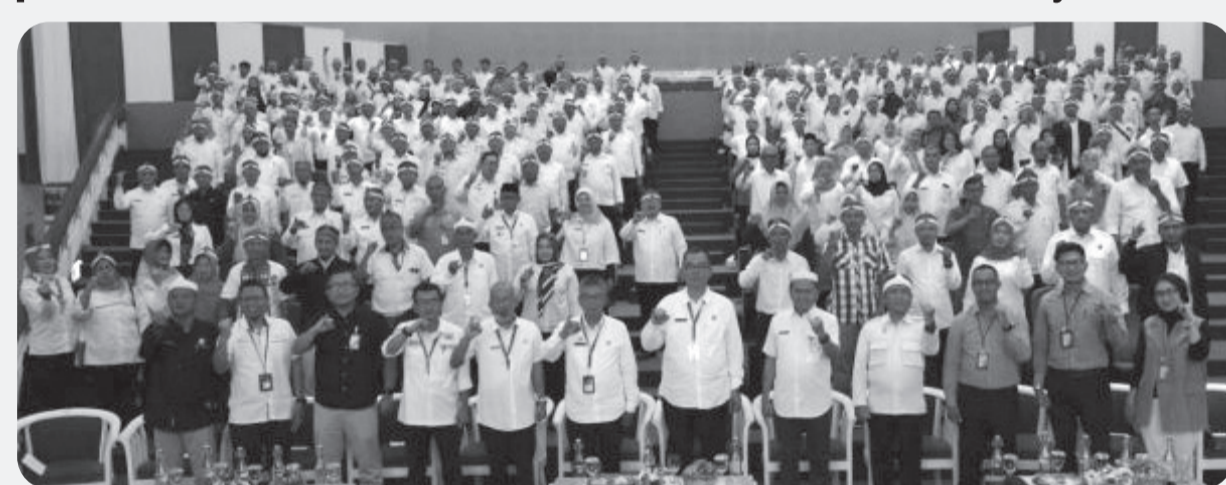
Rapat koordinasi Koperasi Desa dan Kelurahan Merah Putih se-Kabupaten Bogor, di Auditorium Sekretariat Daerah, Cibinong, Selasa (29/7).

Perhatian penuh Presiden Republik Indonesia, Prabowo Subianto terhadap keberhasilan koperasi ini menegaskan bahwa peluncuran 80.000 koperasi merah putih bukan angka kosong, tetapi panggilan untuk menjadikan koperasi benteng ekonomi nasional. Kita bukan hanya penerima bantuan, tapi pelaksana tanggung jawab besar yang