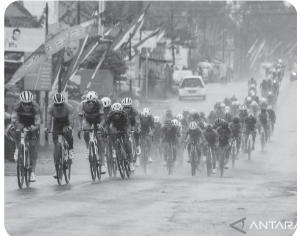
ETAPE TIGA BALAP SEPEDA TDBI 2025

Sejumlah pembalap beradu cepat di bawah guyuran hujan pada gelaran balap sepeda internasional Tour de Banyuwangi Ijen (TdBI) 2025 etape ketiga di Banyuwangi, Jawa Timur, Rabu (30/7/2025). Pembalap Australia menangi etape tiga balap sepeda TdBI 2025.