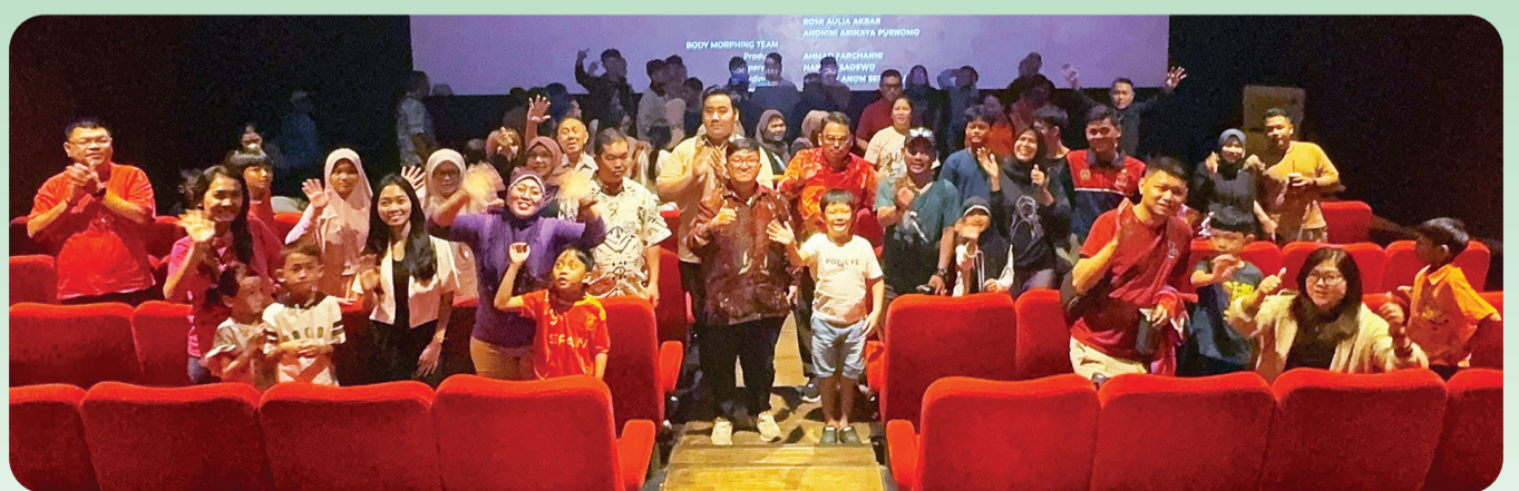
Foto bersama setelah nobar film Believe.