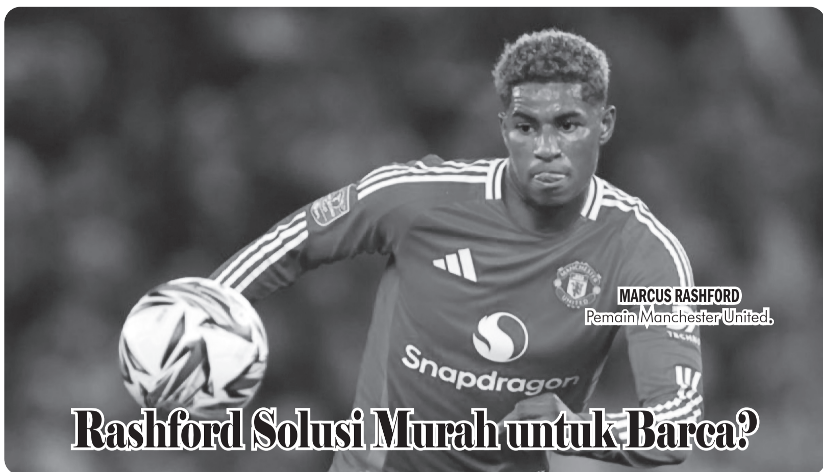
MARCUS RASHFORD Pemain Manchester United.