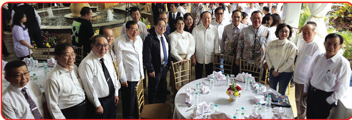
Sejumlah tokoh yang hadir dalam acara.