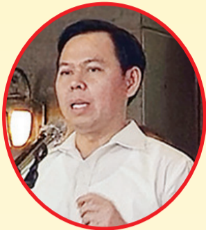
Ketua DPD Sultan Bachtiar Najamudin