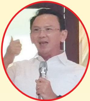
Basuki Tjahaja Purnama