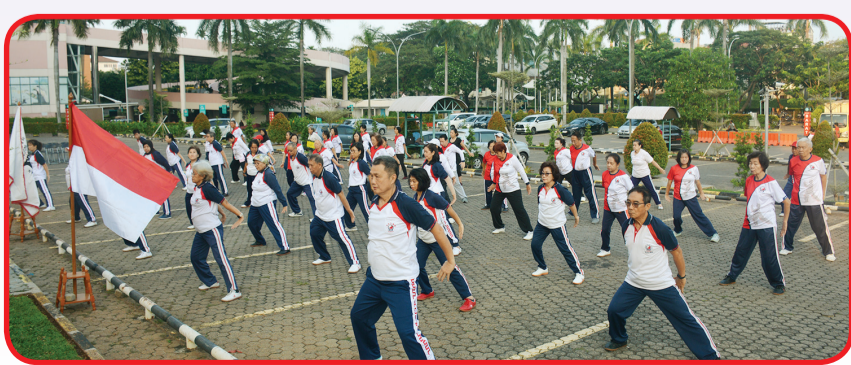
Peragaan senam taiji bersama.