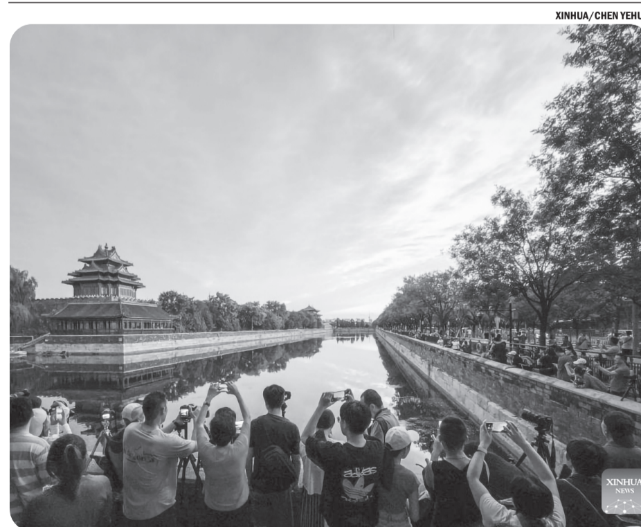
MENARA MUSEUM ISTANA DI BEIJING

"Bendungan-bendungan yang memasok air ke Teheran saat ini berada pada level terendah dalam satu abad," sebut perusahaan pengelola air di Provinsi Teheran dalam pernyataannya, sembari menyinggung soal penurunan curah hujan secara terus-menerus dalam beberapa tahun terakhir. ● tom