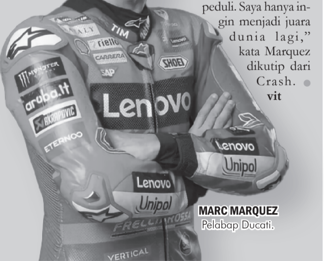
MARC MARQUEZ Pebalap Ducati.

Enam kali juara dunia MotoGP tersebut mene-