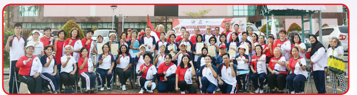
Segegap pengurus dan anggota ADYTI berfoto bersama.