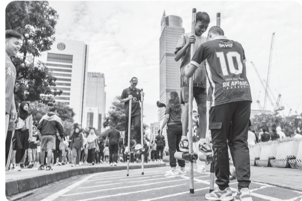
MENGENALKAN PERMAINAN TRADISIONAL SAAT CFD DI JAKARTA

Warga mencoba permainan tradisional Egrang yang diadakan relawan penggerak olahraga DKI Jakarta saat Hari Bebas Kendaraan Bermotor (HBKB) atau Car Free Day (CFD) di Jalan Jenderal Sudirman, Jakarta, Minggu (18/5/2025). Kegiatan tersebut bertujuan menghidupkan kembali permainan tradisional Indonesia sekaligus mengajak masyarakat untuk aktif bergerak di ruang terbuka.