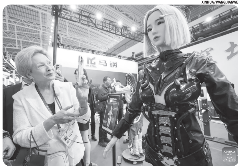
PAMERAN EKONOMI HARBIN KE-34

FBI mengatakan dalam sebuah pernyataan bahwa mereka menanggapi bersama polisi dan petugas pemadam kebakaran, dan telah mengirim penyelidik dan "teknisi bom." ● ans