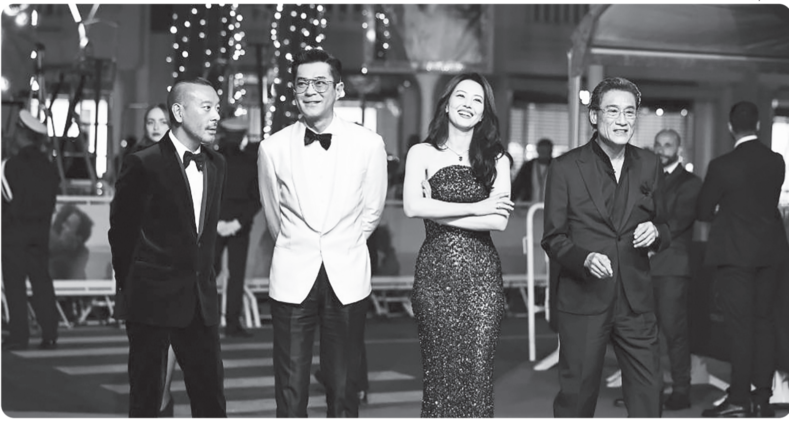
PEMUTARAN PERTAMA FILM "FUNG LAM FO SAAN"

(ka-ki) Pemeran utama Tony Leung Ka Fai, Gao Yuanyuan, Louis Koo, dan sutradara, penulis skenario, serta produser Juno Mak tiba untuk pemutaran perdana film "Fung Lam Fo Saan (Sons of the Neon Night)" di Festival Film Cannes ke-78 di Cannes, Prancis selatan, Jumat (16/5/2025).