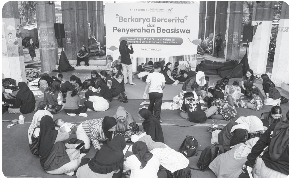
BEASISWA UNTUK MASYARAKAT KOLONG TOL JAKARTA

Sejumlah anak mengikuti kegiatan belajar mewarnai saat acara penyerahan beasiswa dari Dermies by Erha untuk warga Kolong Tol Penjaringan di Jakarta, Sabtu (17/5/2025). Beasiswa tersebut diberikan kepada 50 anak warga kolong tol setempat untuk dapat mengakses layanan sekolah kejar paket secara gratis.