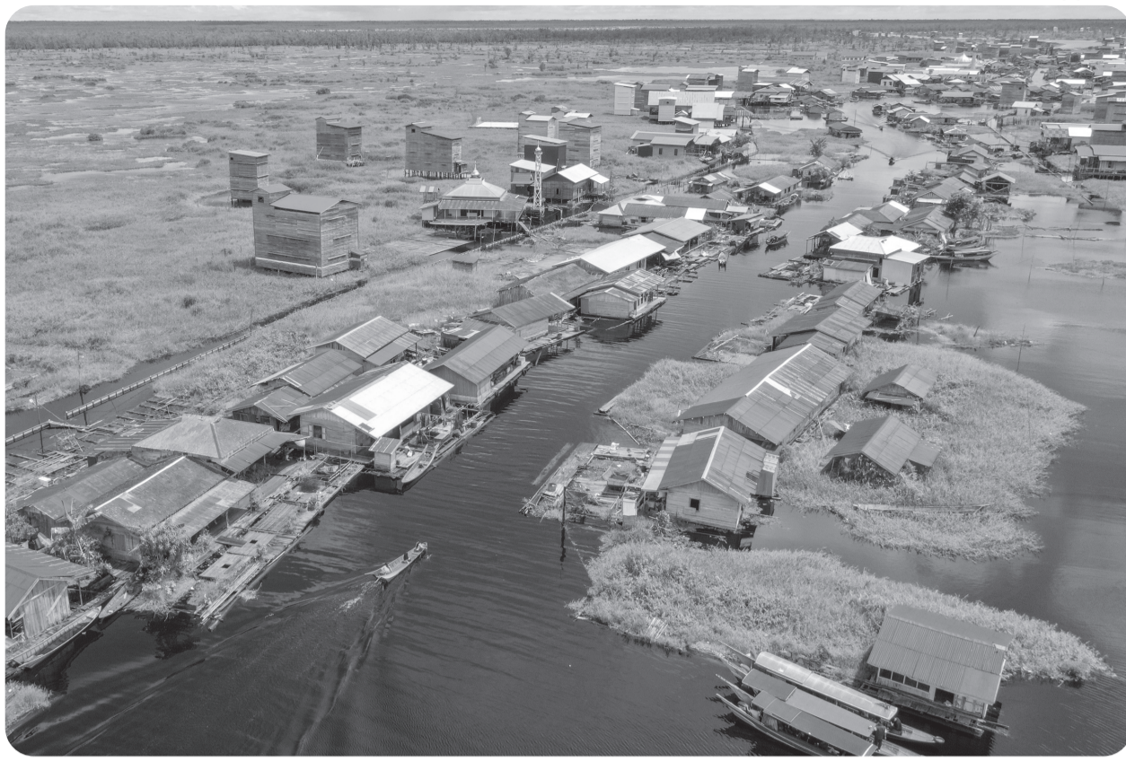
Foto udara suasana Desa Muara Enggelam di Kecamatan Muara Wis, Kabupaten Kutai Kartanegara, Kalimantan Timur, Sabtu (17/5/2025). Desa tanpa daratan yang berada di tengah Danau Melintang tersebut dihuni sekitar 747 jiwa dengan mata pencaharian sebagai nelayan dan menggantungkan hidup pada hasil tangkapan ikan dari sekitar danau, selain itu ada juga warga yang berkebun di ladang terapung atau membuat kerajinan tangan.