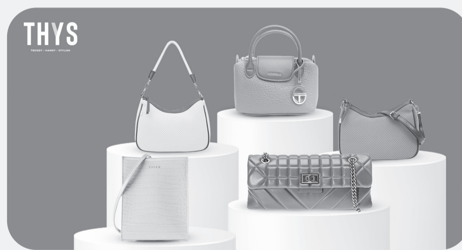
Tas stylish THYS.

JAKARTA (LB) - THYS, destinasi tas stylish setiap hari menghadirkan penawaran istimewa "Stylish Sale" dengan koleksi tas & aksesoris fesyen yang trendy, handy, dan stylish untuk dinikmati hingga 20 Mei 2025.