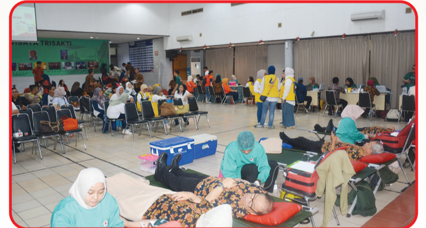
Suasana jalannya donor darah yang berlangsung lancar.