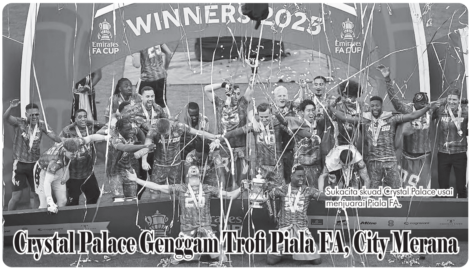
Sukacita skuad Crystal Palace usai menjuarai Piala FA.