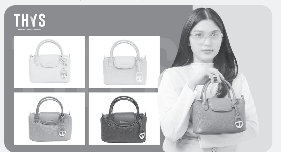
Koleksi tas stylish THYS dalam Stylish Sale.

gan berbagai gaya busana, serta backpack yang praktis untuk sekolah atau bekerja.