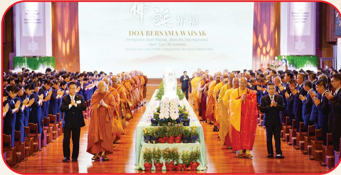
69 bhikkhu sangha, yang turut menyemarakkan acara dengan doa.