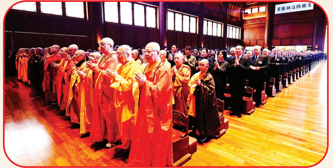
Prosesi doa dipimpin para Bikku.

JAKARTA (LB) - Puncak Peringatan Waisak 2569 BE/2025 berlangsung di Candi Borobudur, tepatnya di lapangan Marga Utama, Kompleks Candi Borobudur, Dimana sebanyak 2.569 lampion mengudara di langit Borobudur, Kabupaten Magelang pada Senin (12/5/2025) malam.