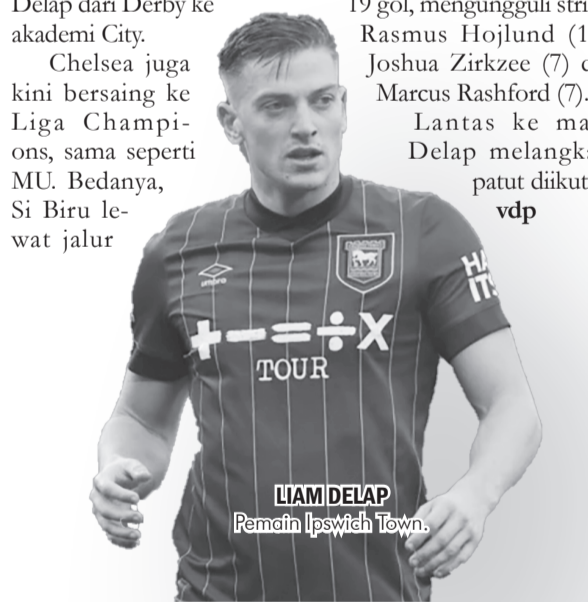
LIAM DELAP Pemain Ipswich Town.

Lantas ke mana Delap melangkah, patut diikuti. ● vdp