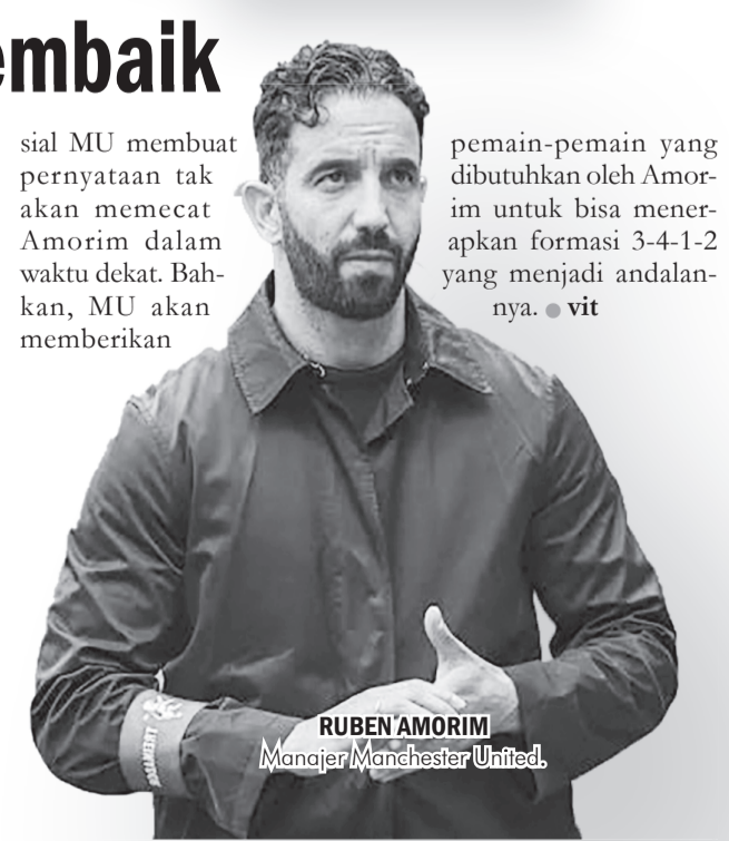
RUBEN AMORIM Manajer Manchester United.

pemain-pemain yang dibutuhkan oleh Amorim untuk bisa meneruskan formasi 3-4-1-2 yang menjadi andalannya. ● vit