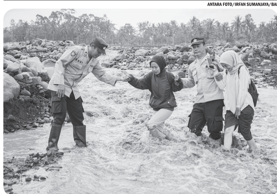
139 KK TERISOLASI AKIBAT LAHAR HUJAN GUNUNG SEMERU

Peristiwa tersebut terjadi di lokasi sumur minyak ilegal dalam kawasan konsesi yang berdasarkan hasil pengecekan masuk dalam wilayah hukum Polres Batanghari. ● osm