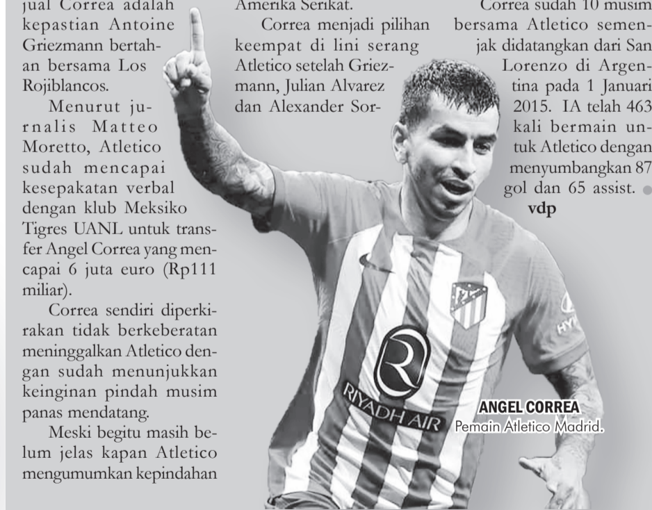
ANGEL CORREA Pemain Atletico Madrid.

Correa sudah 10 musim bersama Atletico semenjak didatangkan dari San Lorenzo di Argentina pada 1 Januari 2015. IA telah 463 kali bermain untuk Atletico dengan menyumbangkan 87 gol dan 65 assist. ● vdp