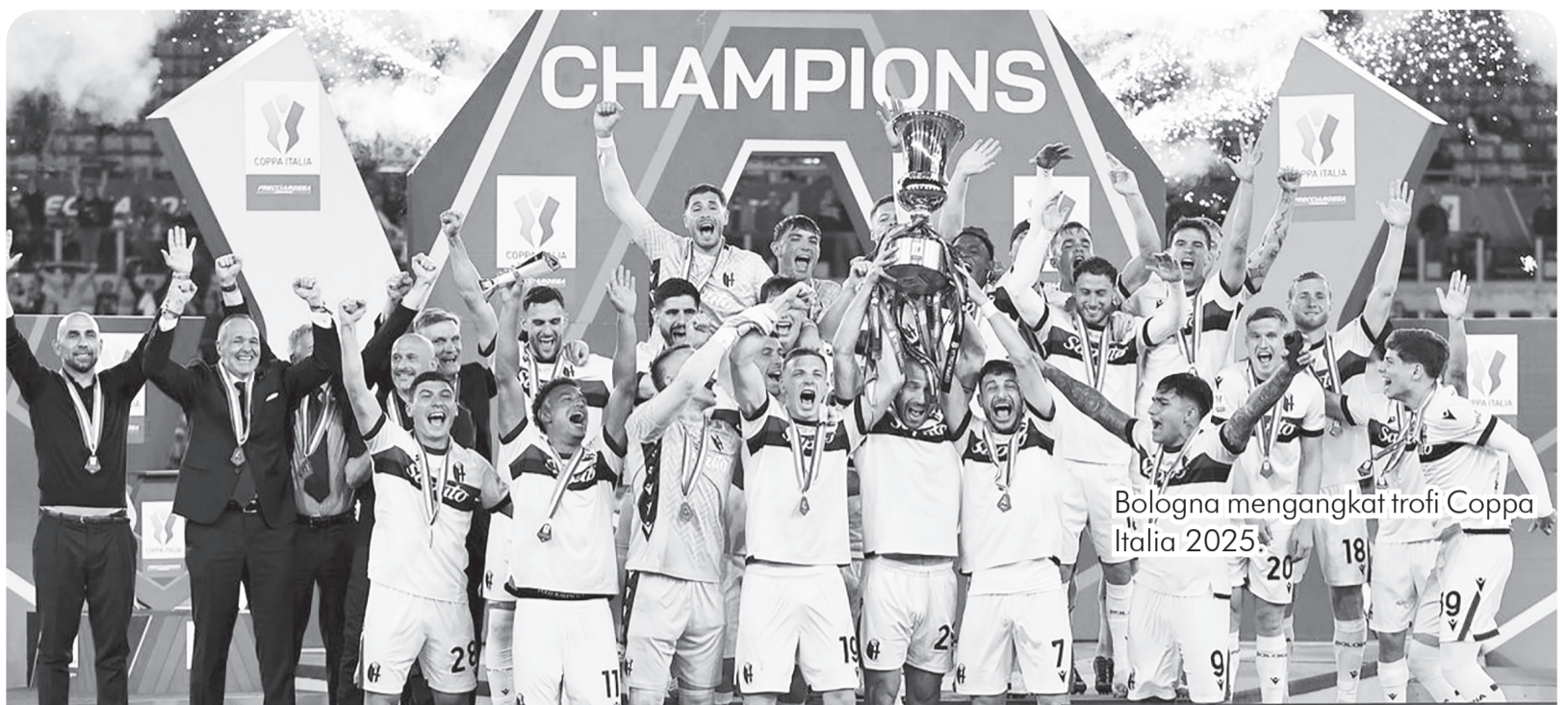
Bologna mengangkat trofi Coppa Italia 2025.